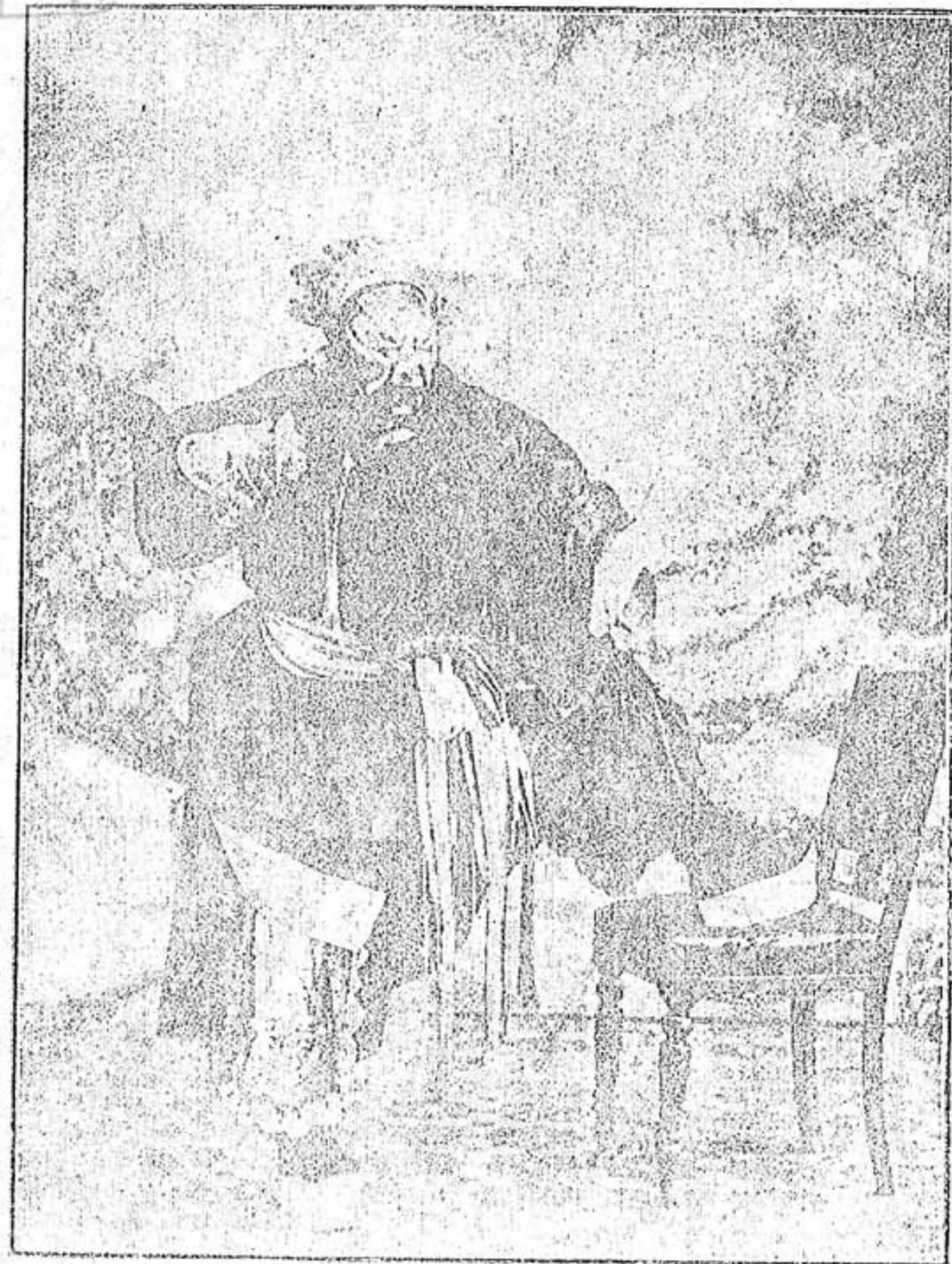
淨角名宿何桂山之鍾道