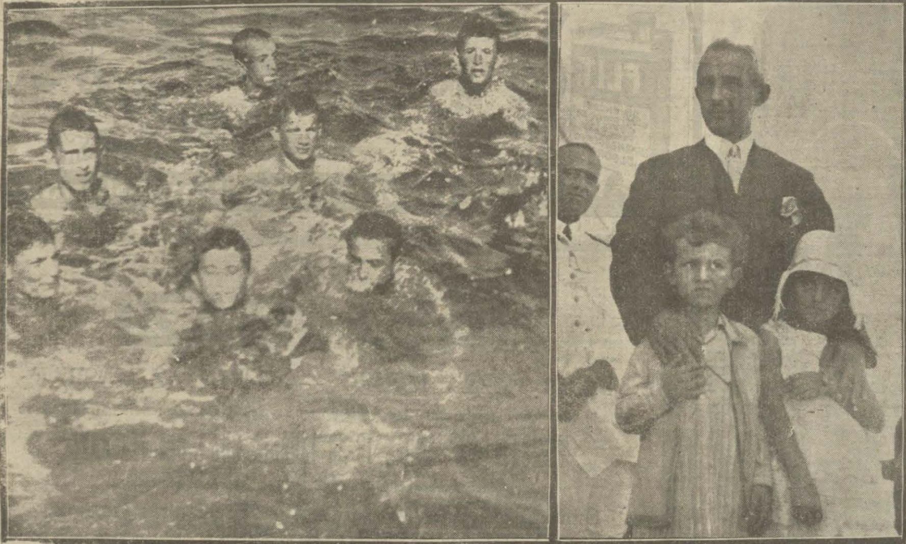
Dün İskeleli deniz İsesi sahilinde mütevvî deniz müsabakaları yapılmıştır. Yarışlarda B. M. M. Reisî Kâzım Pa. Hz. e. ve Şeykî İsmet Pa. Hz. lerî bazı vekil beyler hazır bulunmuşlardır.