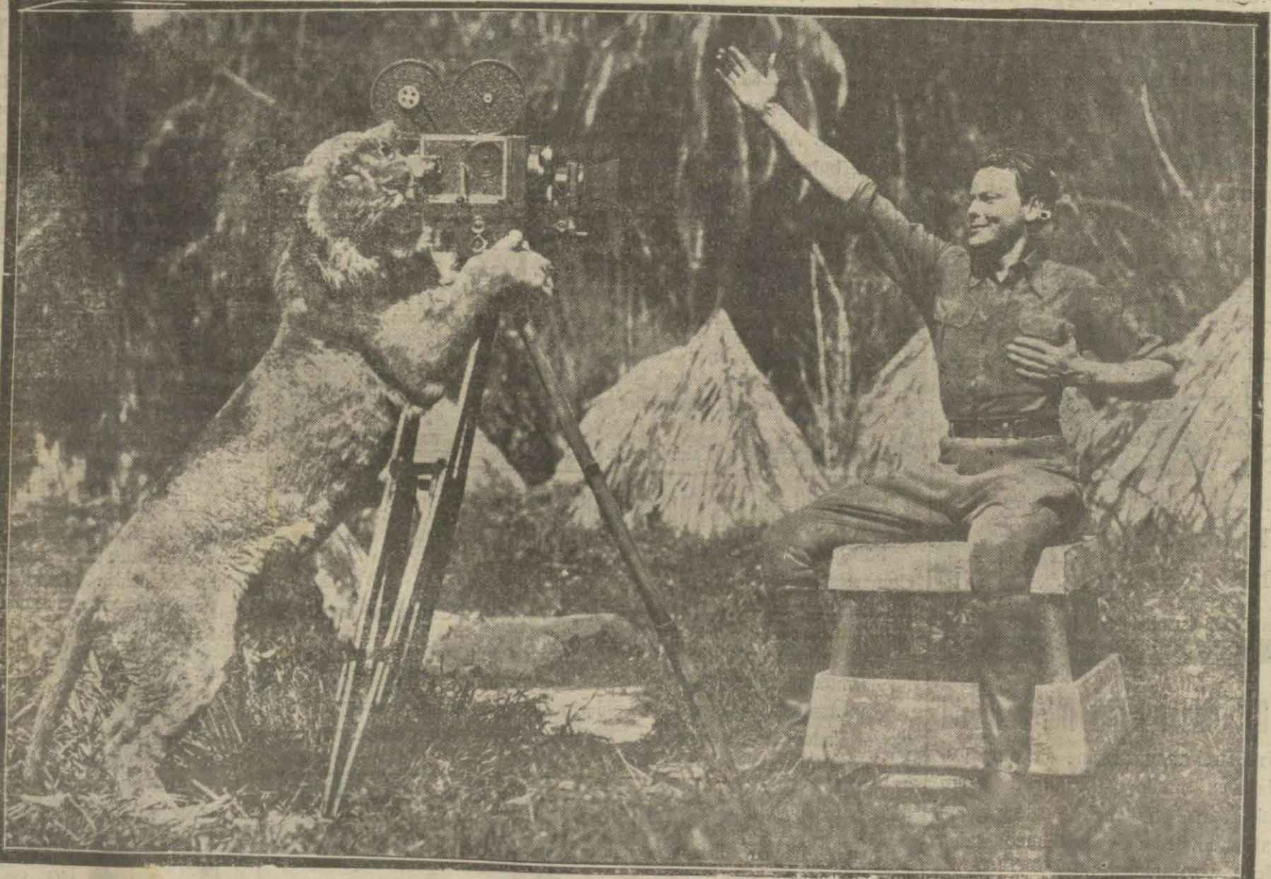
İsveçli aktör Nils Asther pek ziyade şöhret kazanmış bir sinema sanatkâridir. Bilhassa aslanlarla birlikte cereyan eden bir takım sahneleri filme almakta çok meharret göstermiştir. Bu resimde sanatkâr kendi aslanını film makinasının başına getirmiş o suretle kenar resminin aldirtmiştir.