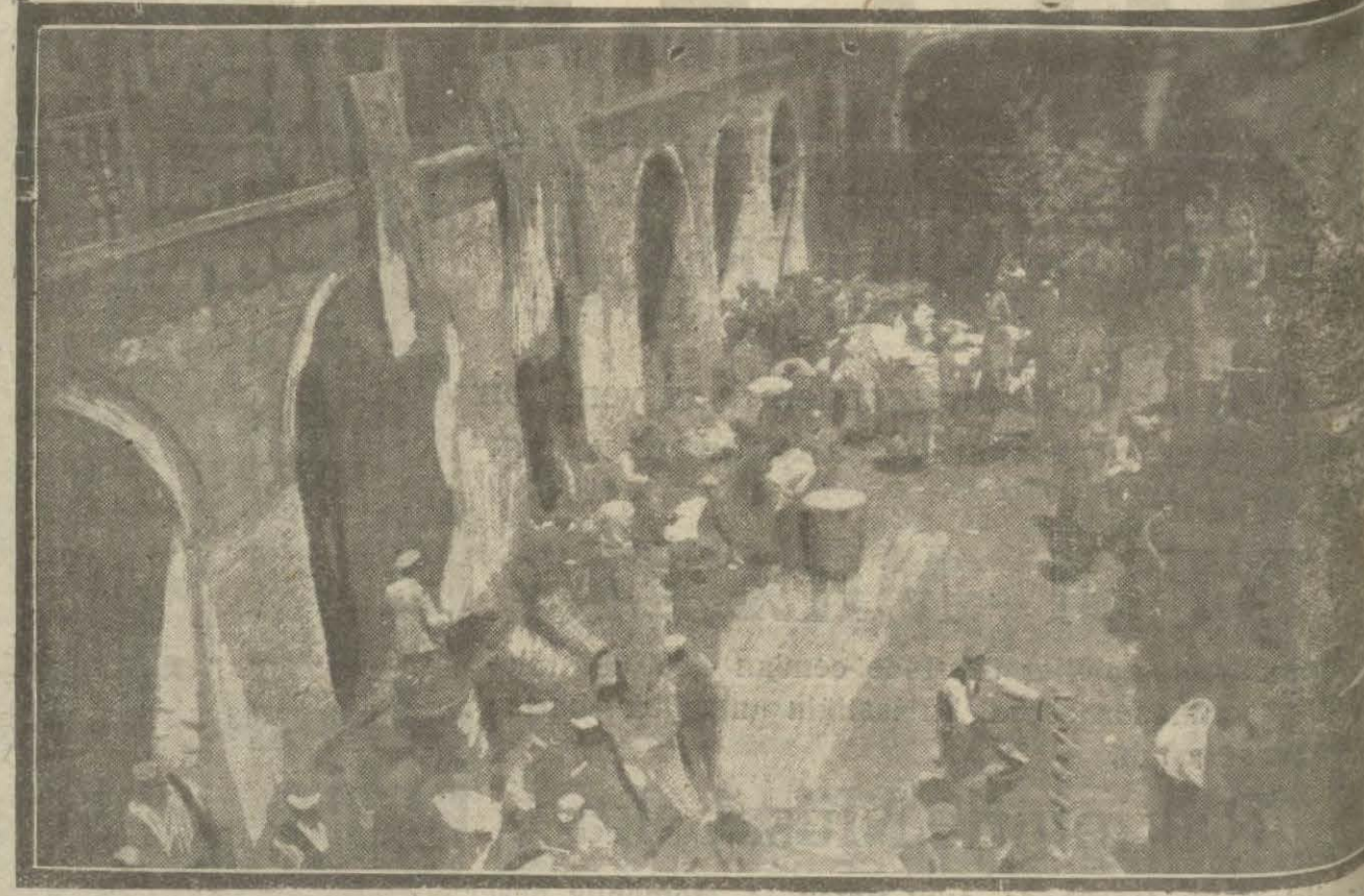
Bursada koza satışı ilk faaliyetinden bir İntiba