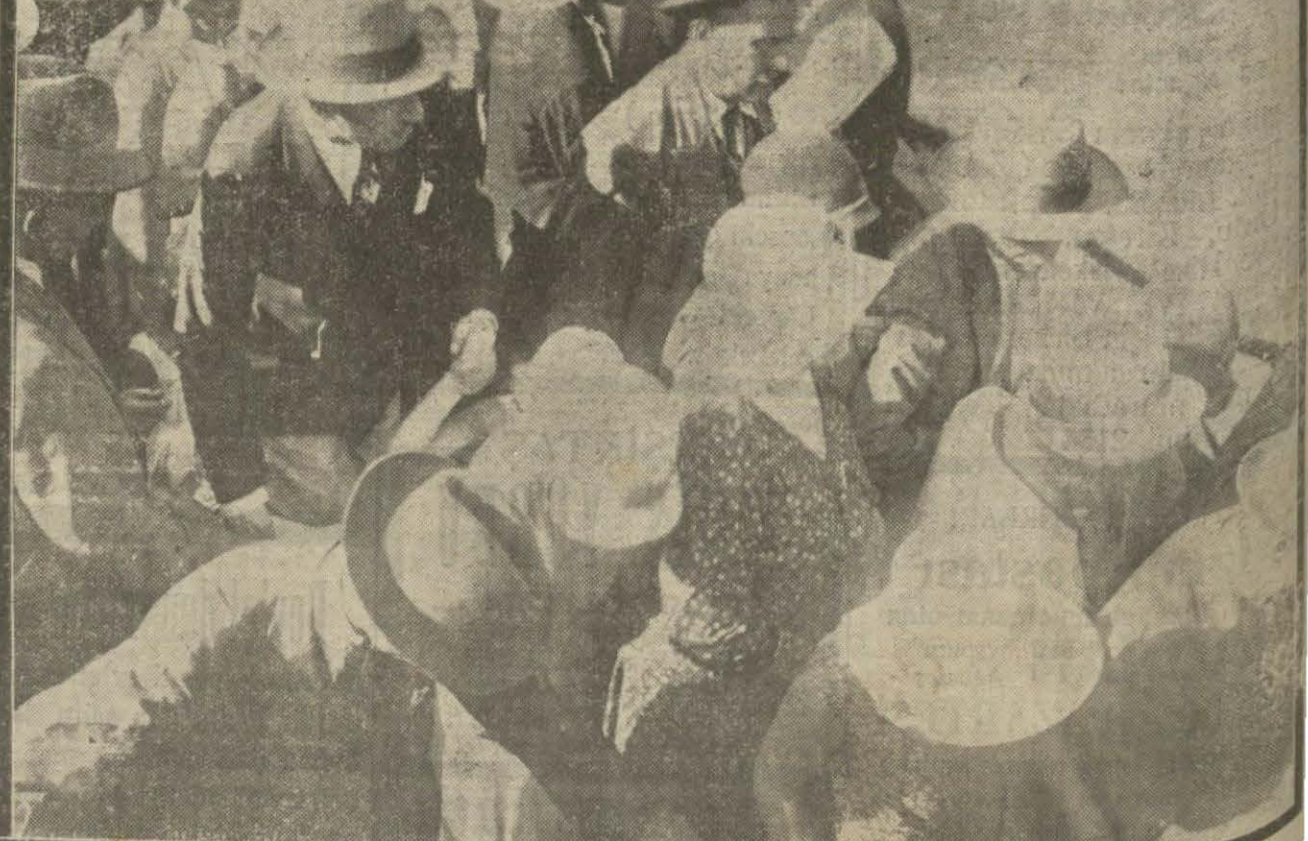
Son günlerdeki sıcaklar tahammül edilmez bir hale girmiştir. Dünye sıcaktan bunalanlar ve ağaçların kurumuşlarıdır. Resim Bugaz ve Ada vapurlarının dünkü izdihamını göstermektedir.