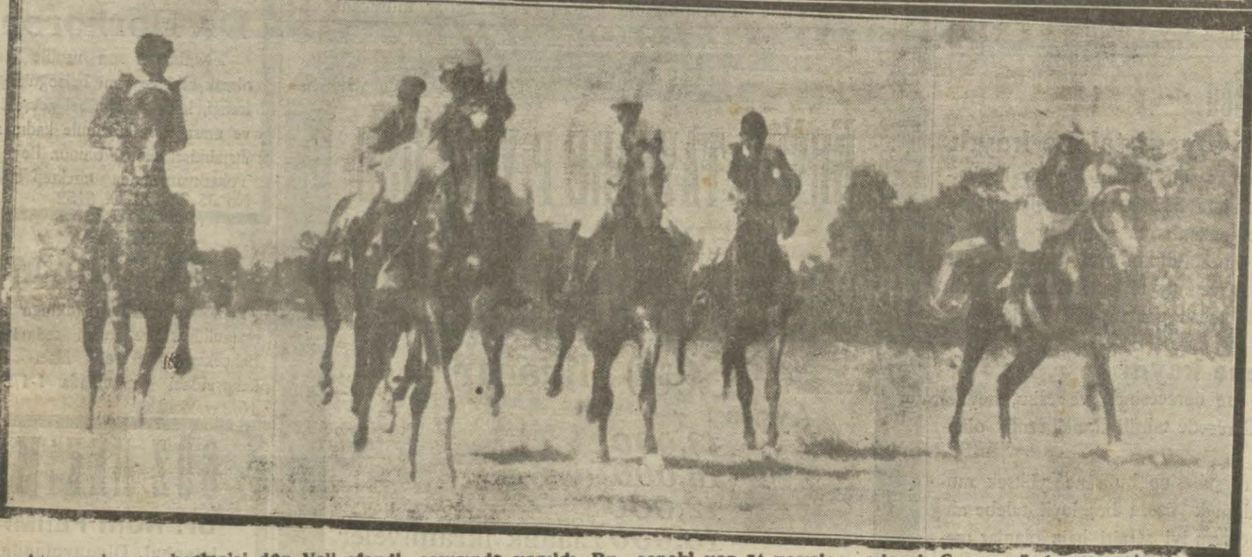
At yarışlarının beşinci gün Veli efendi çayırında yapıldı. Bu seneki yaz at yarışları gelecek Cuma günü niyyet Resimlerimiz seyircilerden ve yarışlardan İntibaldır.