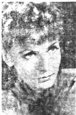
(一度為爾吉勃情人的嘉寶)

Parade)一片之後，此後一帆風順，有聲銀壇，一般觀眾，譽為范倫鐵諸後之唯一情人。其後與嘉寶合演數片，聲名更著。然有聲片出世後，吉以發音不佳，不能上銀幕。遂暫時退休，潛心研究對白，然觀眾對其印象，已日就淡薄，其後雖東山再起，然已不受人歡迎矣。前年，嘉寶延其助演「瓊宮恨史」一片，結果無何等