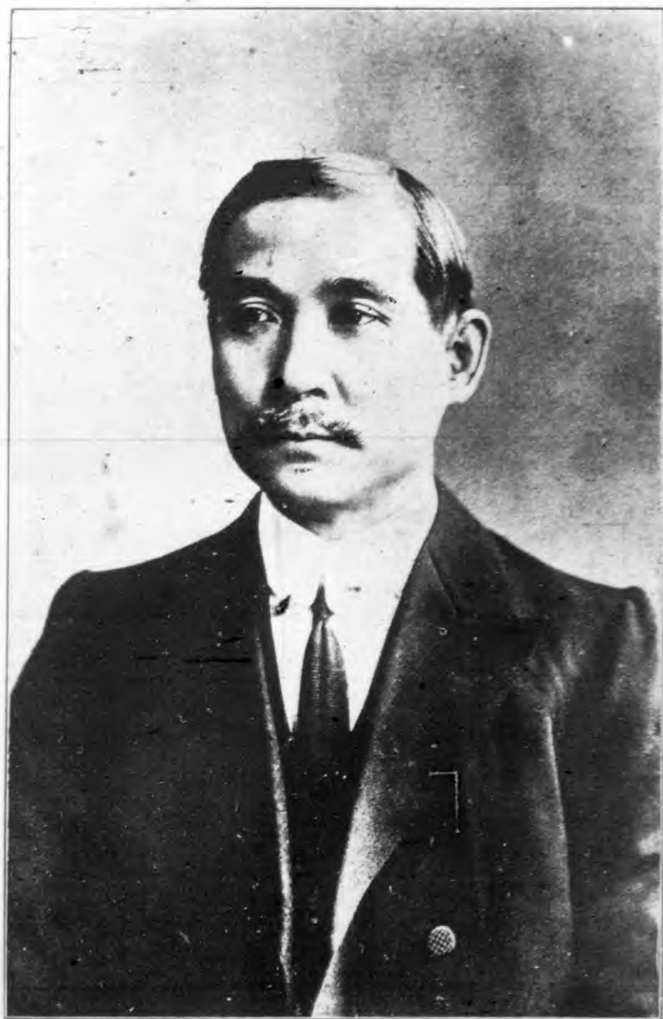
總 理 遺 像