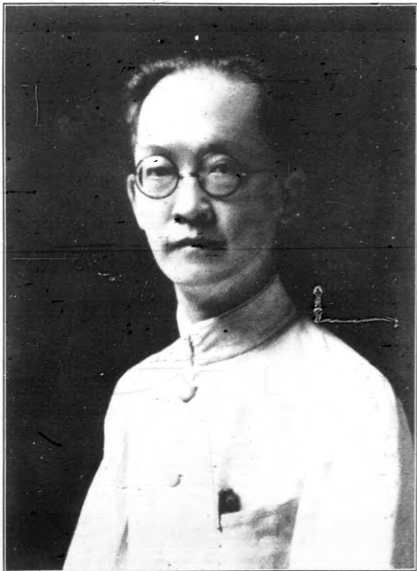
立法院院長 胡漢民肖像