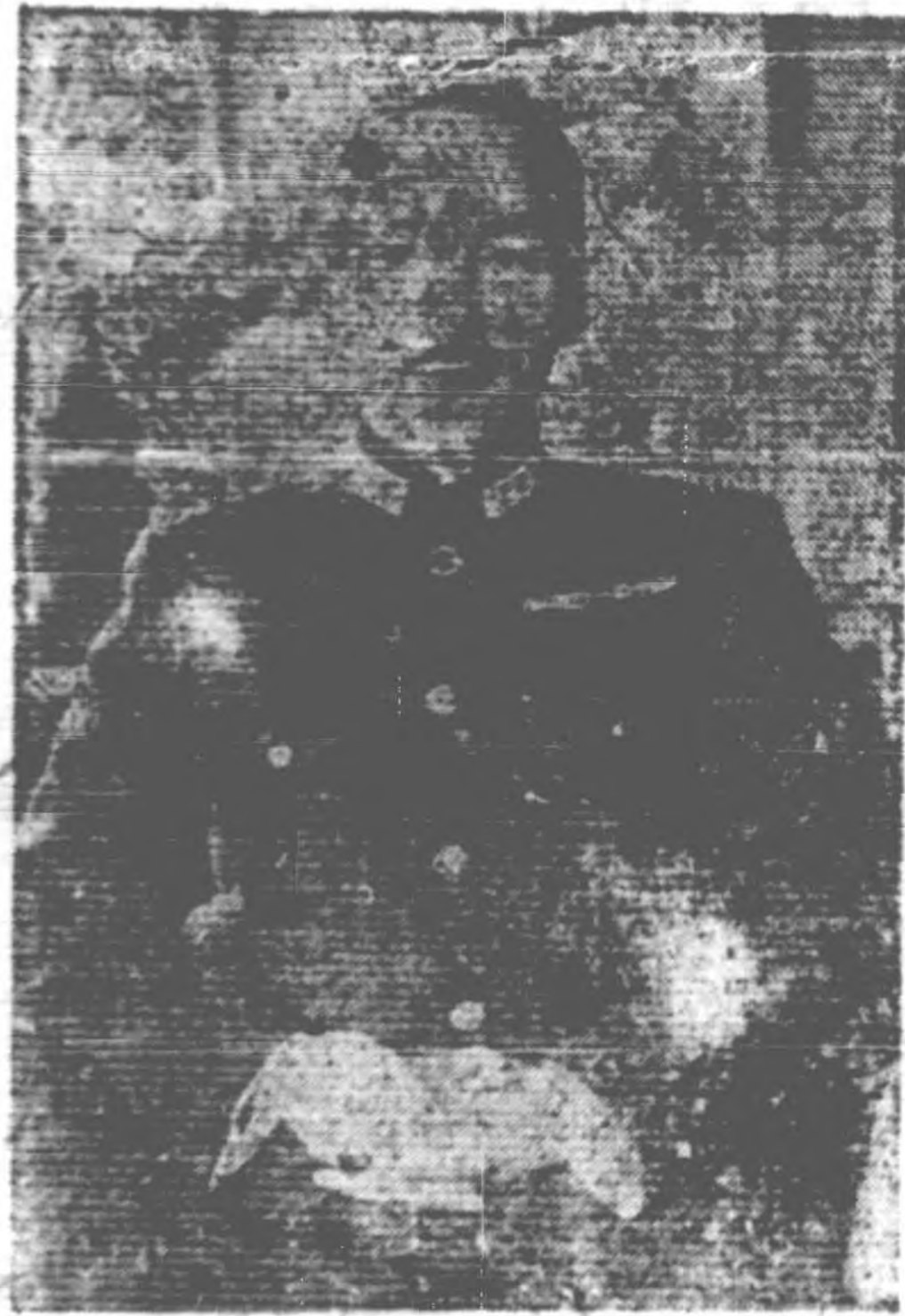
總 裁 肖 像