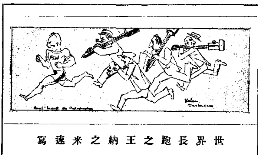
世界長跑之王納米之速寫

美國有許多百碼好手如托辟諾，史威夫脫，克萊那等都有九秒五的好成績。不過這些新手都是沒有甚麼名的，我想說不定下屆大會他們一輩中會跳個冷門獨出呢。