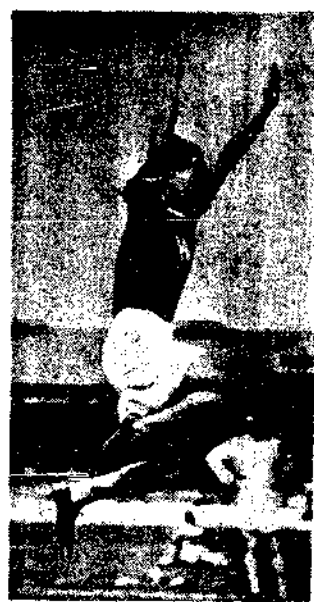
日本三級 跳名將織 田幹雄氏 最後一躍 之姿勢。