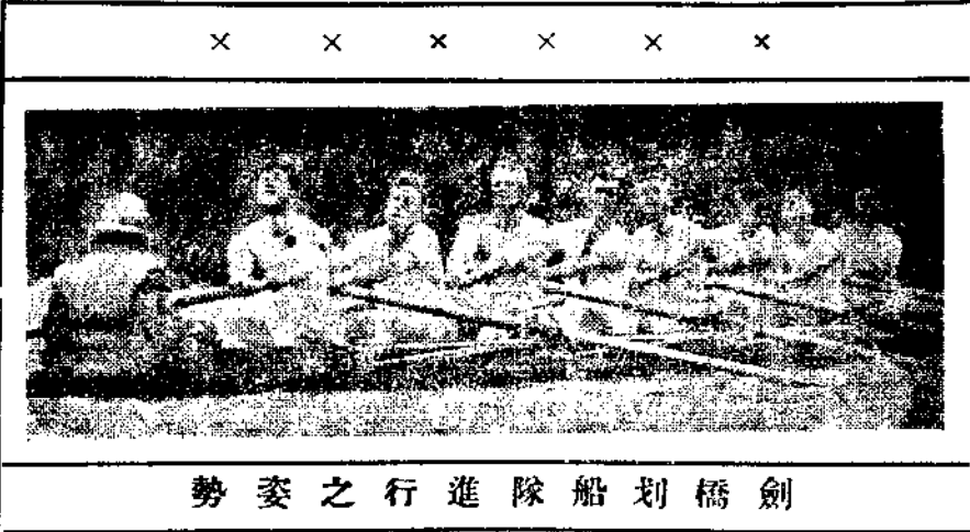
劍橋划船隊進行之姿