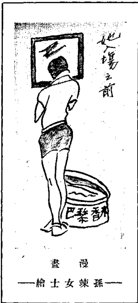
漫 畫 ——繪 士 女 竦 孫——

，跑得快，在中線左進，接球在手，一個箭步，球已入籃；在急進衝鋒時，他表演得最精彩。前鋒于燕川是本年的隊長，指揮全場，常能出奇制勝，愈打到緊要關頭，愈能穩重不亂。前鋒朱民聲個小善鑽，能在千軍萬馬中把球兒帶進帶出，遞得穩，擲得準，可惜經驗少點，戴世光是清華三年不改的中鋒，能