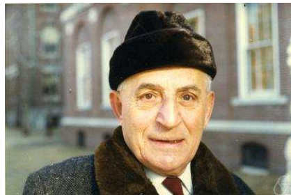
Oscar Zariski (1899-1986)

In Proposition 2.8 haben wir gezeigt, dass die affin-algebraischen Teilmengen eines affinen Raumes die Axiome für abgeschlossene Mengen einer Topologie erfüllen. Diese Topologie nennt man die Zariski-Topologie.