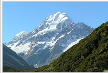
O Monte Cook é a maior montanha da Nova Zelândia.

A Nova Zelândia é composta por duas ilhas principais, a Ilha Norte e a Ilha Sul , e numerosas pequenas ilhas, algumas das quais bastante longínquas. A área total é de 268.680 km 2 , um pouco menor que a Itália ou o Japão , e um pouco maior que o Reino Unido . O país estende-se por mais de 1600 quilômetros ao longo do seu eixo principal norte-nordeste com cerca de 15.134 km de litoral.