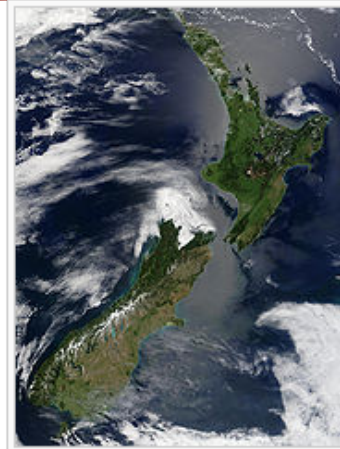
Imagem de satélite da Nova Zelândia.

Muito afastada das terras mais próximas, a Nova Zelândia é, entre as massas de terra de dimensões consideráveis do planeta, aquela que está mais isolada. Os seus vizinhos mais próximos são a Austrália , para noroeste, e a Nova Caledónia , Fiji e Tonga , para norte.