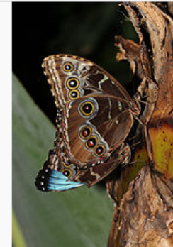
Borboletas da espécie Morpho peleides .