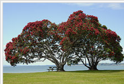
A árvore de metrosídero floresce no início do verão.