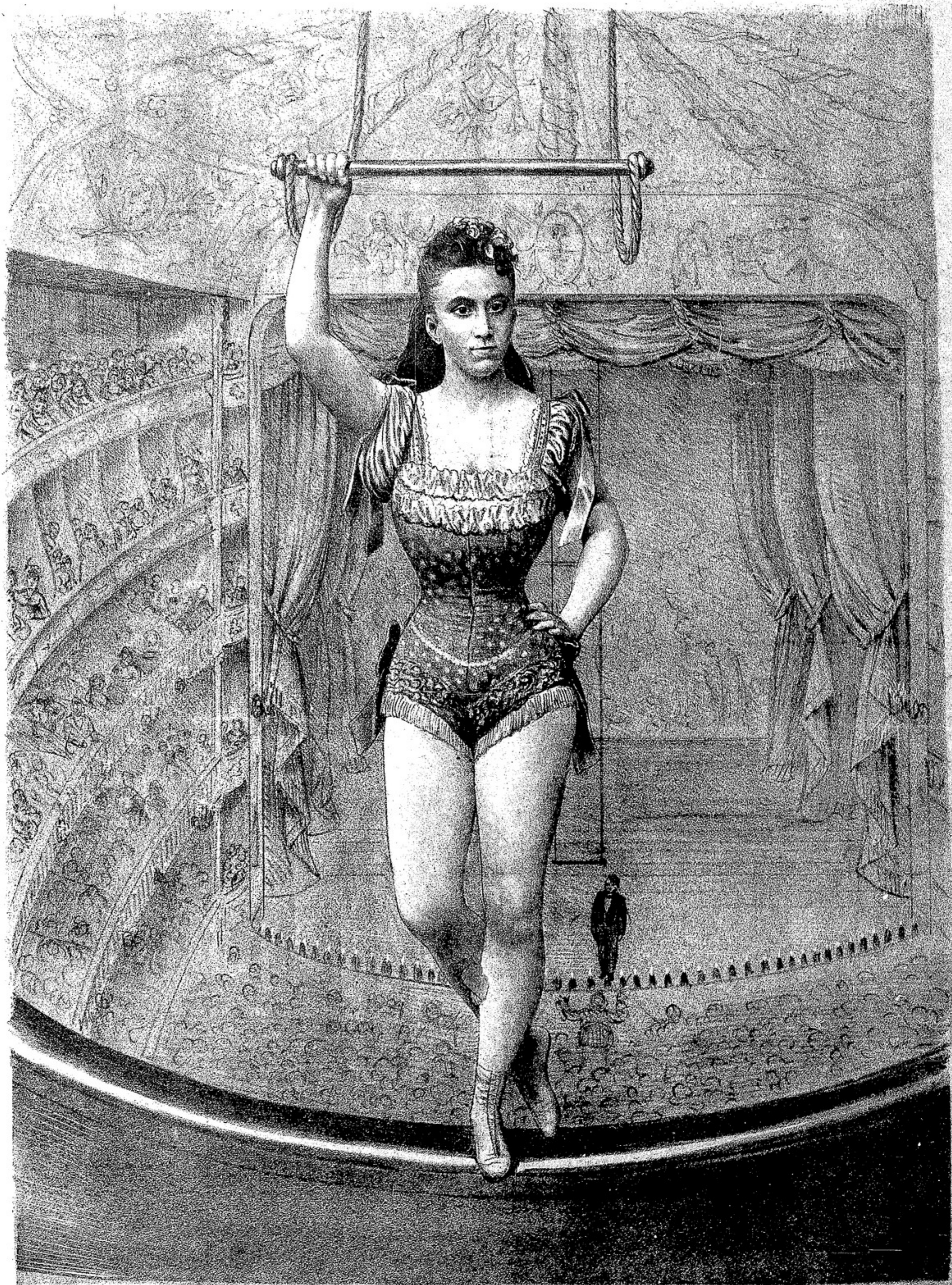
VICTORIA , la REINA del AIRE que trabajará mañana en COLON