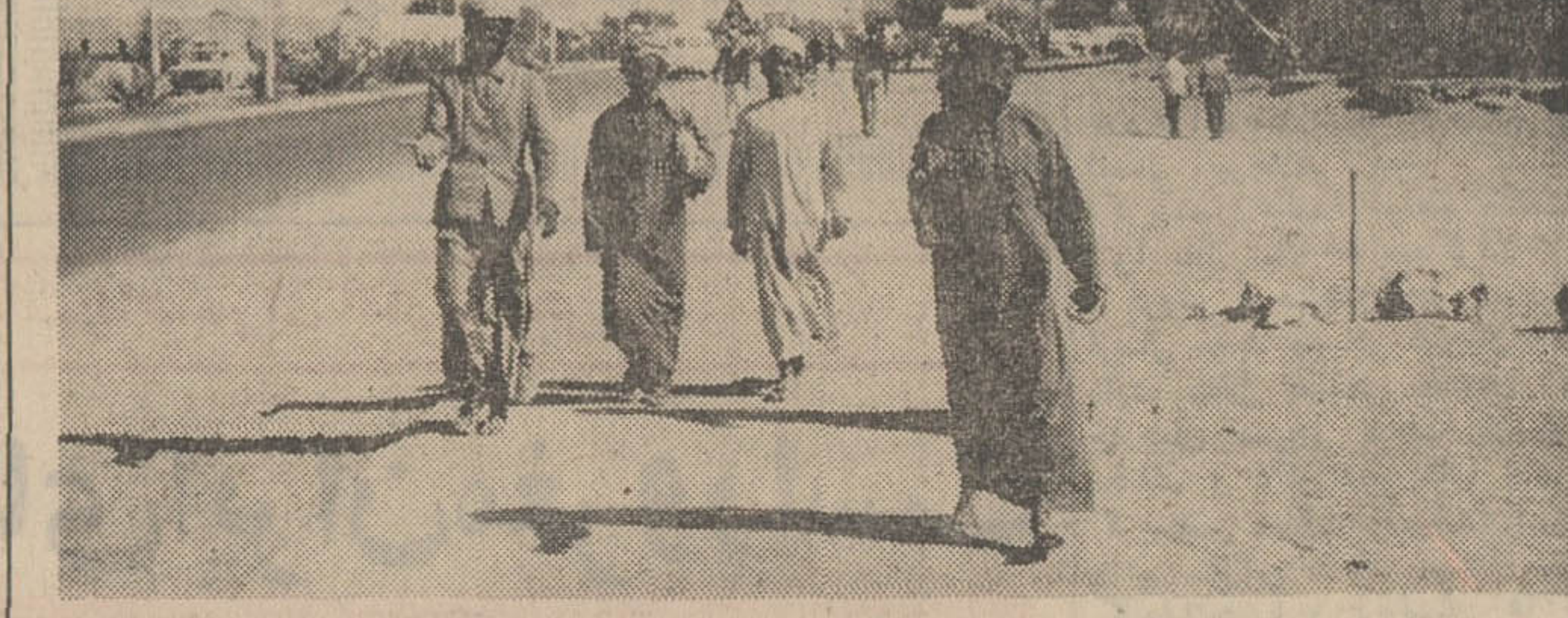
شهری مدرن در قلب مسوژان صحرای ابوظبی

راشاید بتوان درعجله ویرخوردار نبودن از یک نظام صحیح اجتماعی و اقتصادی و اجرائی در این سرزمین یافت . این یک اصل اقتصادی است که تروت و جمع در اجتماعات انهم در اجتماع نظیر ابوظبی همواره با جیفومیل توام است . انسان فقیر یا در راه و در کربان و در کمتری صت به کریبان و در عین حال به راه حل آنها به روشنی واقف است . شاید افزایش مخمتر درآمد بیشتر گره از مشکلات او بگشاید . اما انسان متمول و تروتمند بهمان نسبتی که در گرداب درها و گرفتاری های بیشتری سرگردان است ، بهمان نسبت آگاهی کمتری بهمان مشکلاتش دارد و تا زمانیکه درپاید تروت و درآمد را در چه راهی و به چه نحوی به مصرف برساند قست های عمده‌ای از این تروت درراههای مختلف تلف گردیده است .