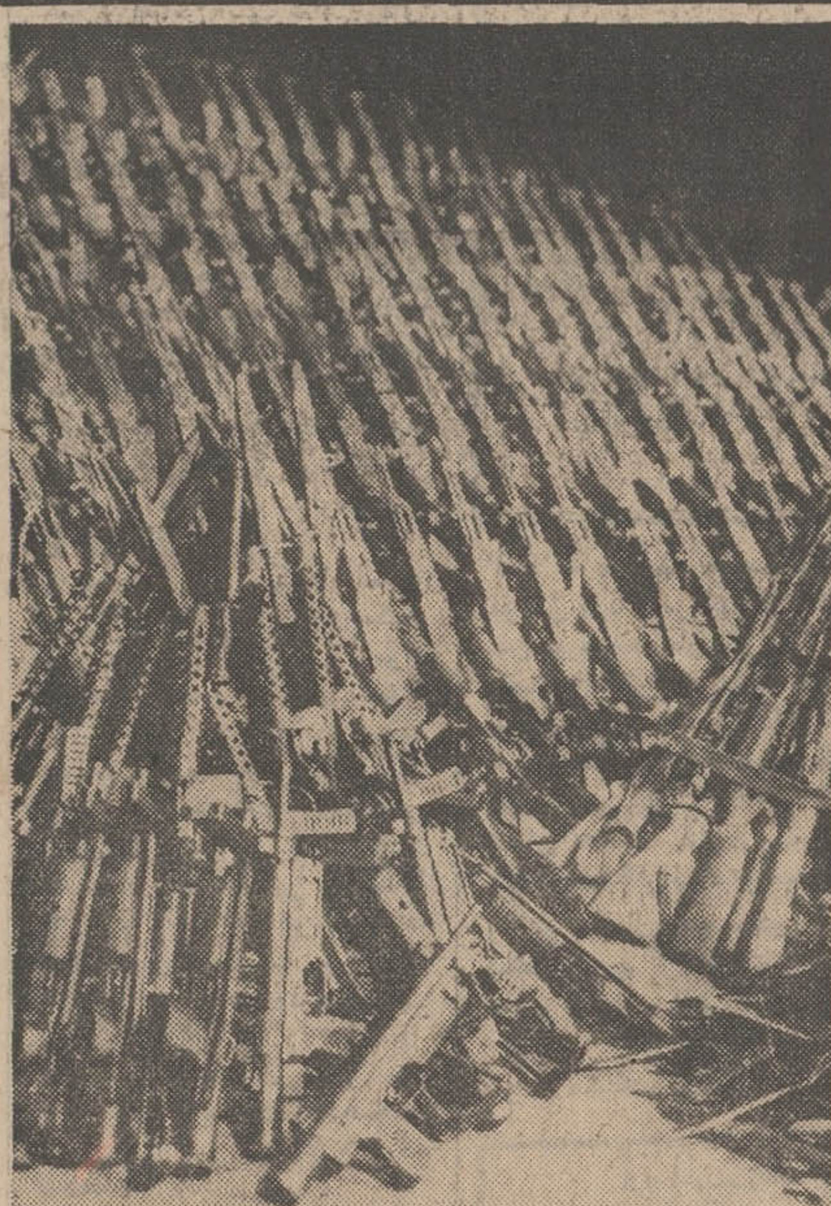
تعدادی از مسلسل ها و تفنگ های که بختیار در عراق برای خود به ایران فرستاده بود دست مأموران افتاده است

امروز مقامات امنیتی کشور از ماجرای چندسال اخیر بختیار و حوادث جاسوسی و ضد جاسوسی پر هیجانی پره برداشتنند و بالاخره فاش ساختند که فعالیت بختیار و همکاری وی با عراق و جاسوسی های که عراق گردانده آن در ایران و مبارزات وسیع سازمان های امنیتی ایران در شبکه های سازمان «بختیار توده» چه بوده است؟ در مصاحبه ای که امروز یک مقام امنیتی در محل تلویزیون کانال ۳ پمیل آورد آشکار ساخت که بسیاری از حوادث کوچکی که در روزنامه ها منتشر میشد، قسمتی از طرحها و فعالیت های وسیع جاسوسی و ضد جاسوسی بود. و در اجرای یک طرح ترور و روحتنک و کشتی معاون سابق رئیس جمهور عراق در تهران که گدایانه انجام گرفت خبری برای کم کردن عوامل جاسوسی عراق منتشر شد. این مصاحبه مقارن ساعت هشت و نیم در یکی از استودیو های بزرگ کانال ۳ انجام گرفت و وقتی نمایندگان مطبوعات وارد استودیو شدند تصور کردند وارد اسلحه خانه ارتش شده اند. تمام تفنگ، نارنجک، مسلسل و فشنگ، بمب، بیسم، لاس، و وسایل تخریب و جنگ پارتیزانی که بختیار توسط یکدیگر های سیاسی عراق و مقامات سفارت عراق و عوامل خود به ایران فرستاده بود همه بترتیب منظمی قبلا در استودیو دیده شده بود تا نمایندگان مطبوعات از نزدیک آنرا مشاهده کنند پس از چند دقیقه که بازدید از اسلحه ها انجام گرفت معاون وزارت اطلاعات طی مقدمه کوتاهی علت تشکیل این جلسه که روی تقاضای مکرر مطبوعات بود توضیحاتی را در مورد مقام مزبور مصاحبه خود را که در تاریخ فعالیت های امنیتی کشور و جاسوسی و ضد جاسوسی مملکت بر سابقه بود شرح بر انجام داد در صفحه ۲