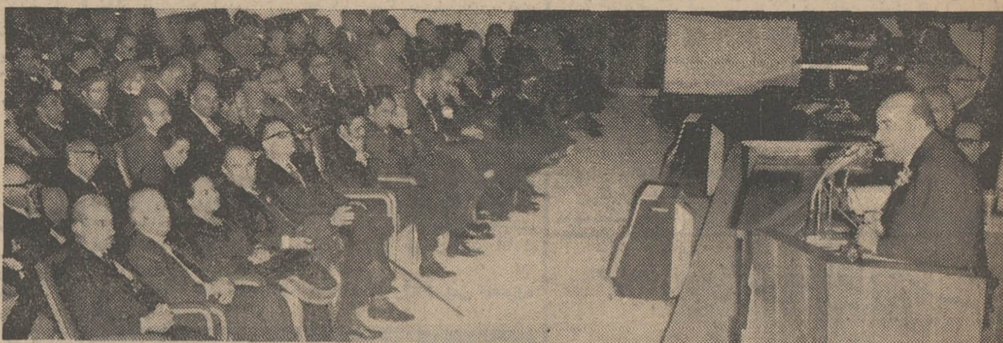
آقای هویدا نخست وزیر درجلسه صردیروز فراکسیونهای پارلمانی حزب ایران نوین در مجلس سناوشورایمجلسی یسرفرت های کشورو سیاست خارجی ورشد اقتصادی کشور را تشریح کرد. در عکس بالا آقای هویدا هنگام صحبت برای نمایندگان مجلسین دیده می شود درردیف اول عدهای از وزراء کابینه و دبیر کل حزب دیده میشوند.

درده سال اخیر ایران دهه یسرفرت وچپس را گذراند. در درزمینه نفت مادیر به جنبه سیاسی آن توجه نداشتیم. ما برای ماصرف جنبه اقتصادی داره برای تعیین قیمت نفت خام درخلیج فارس وارد مذاکره خواهیم شد. سیاست خارجی ما متکی به اصول سازمان ملل است ایران باید دراین منطقه یک ایران قوی و نیرومند باشد. درزمینه تقسیمات کشوری ما بهر بود آمانده است و ما استانی را درحد لازم افزایش خواهیم داد.