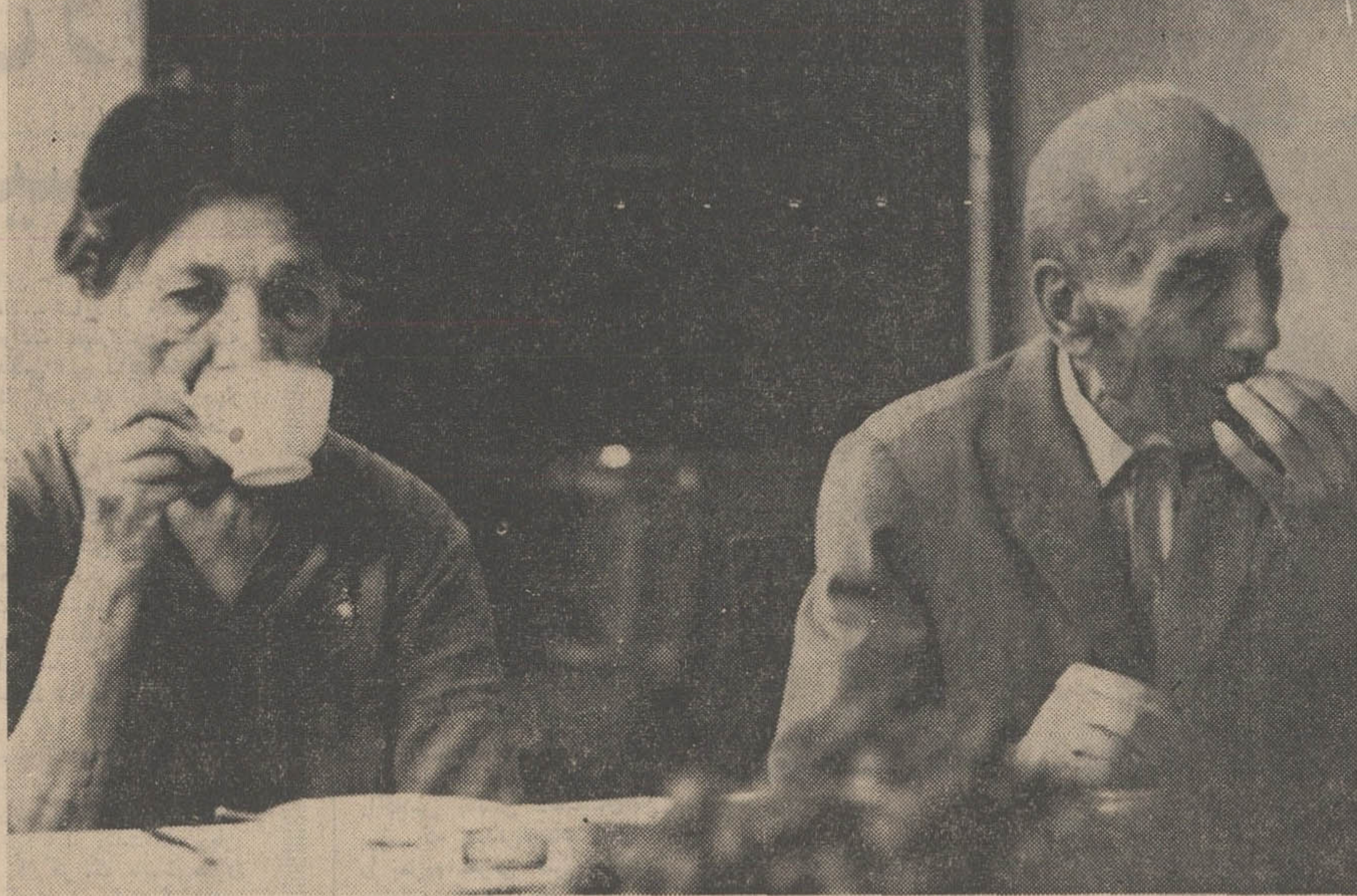
سرای سالمندان - کم کم آماده پذیرایی از بابا بزرگها و مادر بزرگها خواهد بود تا گرد هم آیند .

فضای سبز ، از سرزندگی و جوانی حکایت دارد . سبزی و خرمی درتن همگان عطر جوانی می پراکند و تابراین ، در سراهای مخصوص سالمندان مساله فضای سبز اهمیت بسیار دارد . نهن سرای سالمندان ایران که در محله خوش آب وهوا «بلور» تهران - قرار گرفته است ، دو هزار و دو سده و پنجاه متر مربع زیر بنا دارد و مساحت کل آن به هفت هزار