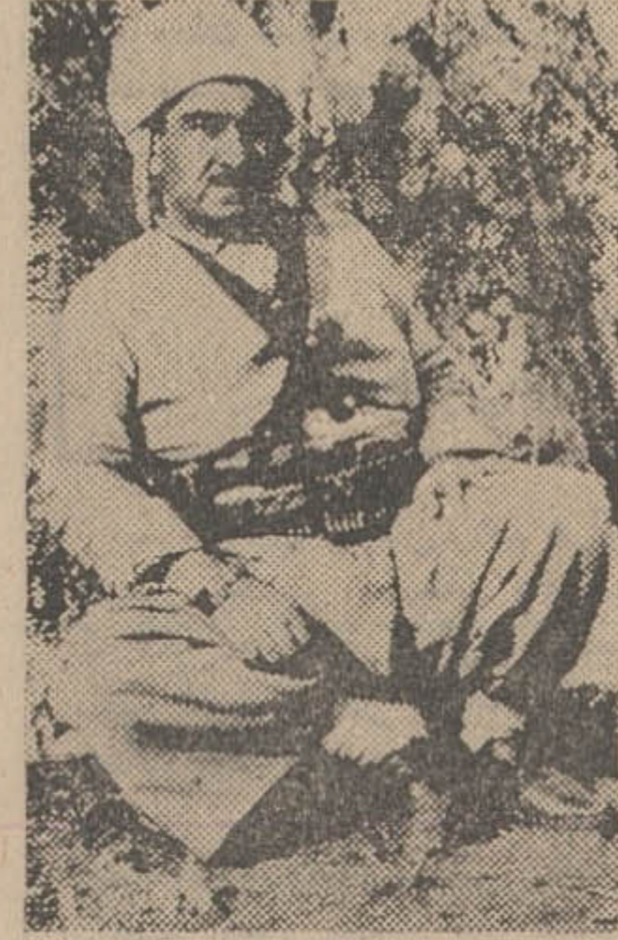
ملا مصطفی بارزانی

بعد از تیر اندازی به اتومبیل «ادریس» پیش آمد، نیز شدت ابر از نگرانی کرد. ملا مصطفی پسرش را بمناسبت عید نظر و برای گفتن تبریک به رهبران عراق به بغداد فرستاده بود و او نیز در چنین موقعیتی میخواستند وی را بکشد. رهبر کردهای عراق راقا در عصبانی کرد است.