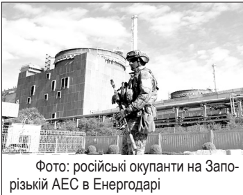
Фото: російські окупанти на Запорізькій АЕС в Енергодарі

У спробі зупинити український контрнаступ Росія може не обмежитись підривом Каховської дамби. Українська влада попереджає про ймовірність того, що агресор візьметься за Запорізьку атомну електростанцію.