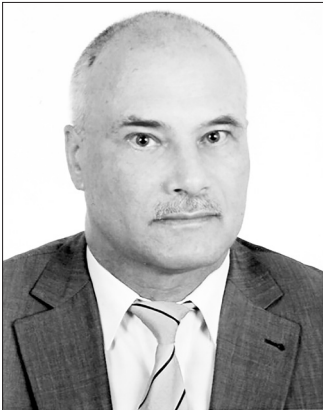
Петро Григорович Ляшко

А був такий Сергій Петрович Бабич - секретар ЦК комсомолу України. З ним я колись познайомився на черговому пленумі ЦК комсомолу, коли ще працював зоотехніком в колгоспі і був секретарем комсомольської організації. Тепер я вирішив звернутися до нього, так як він (будівельник за освітою) уже працював у Київському міськомі партії на посаді завідувачого будівельним відділом.