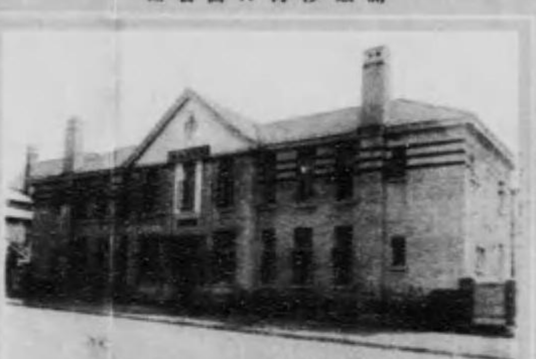
館書圖口河沙南鐵滿