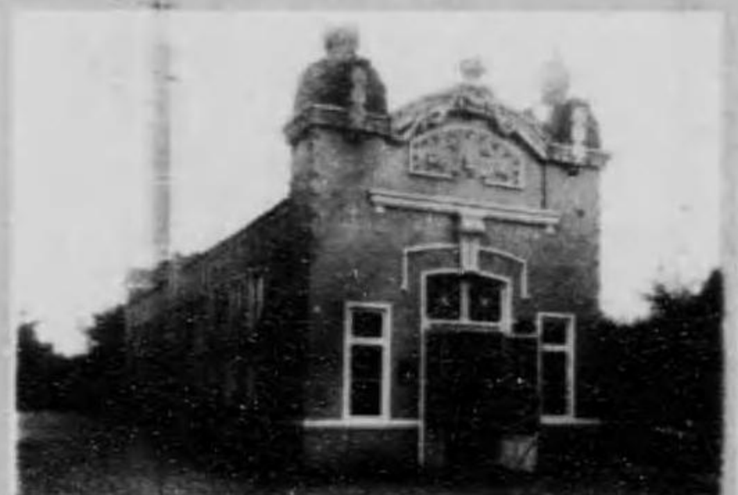
館書圖遊氣電鐵滿