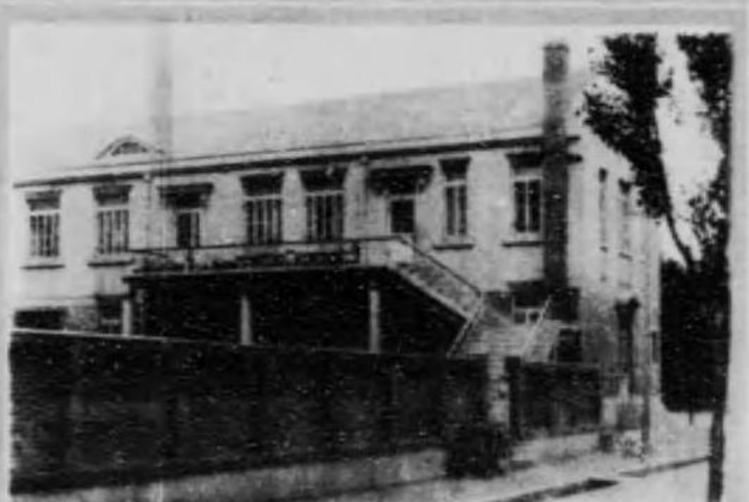
館書圖口河沙鐵滿