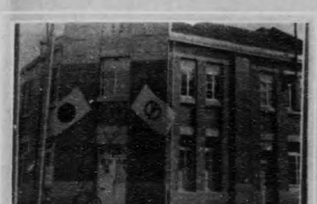
館書圖湖濱水鐵滿