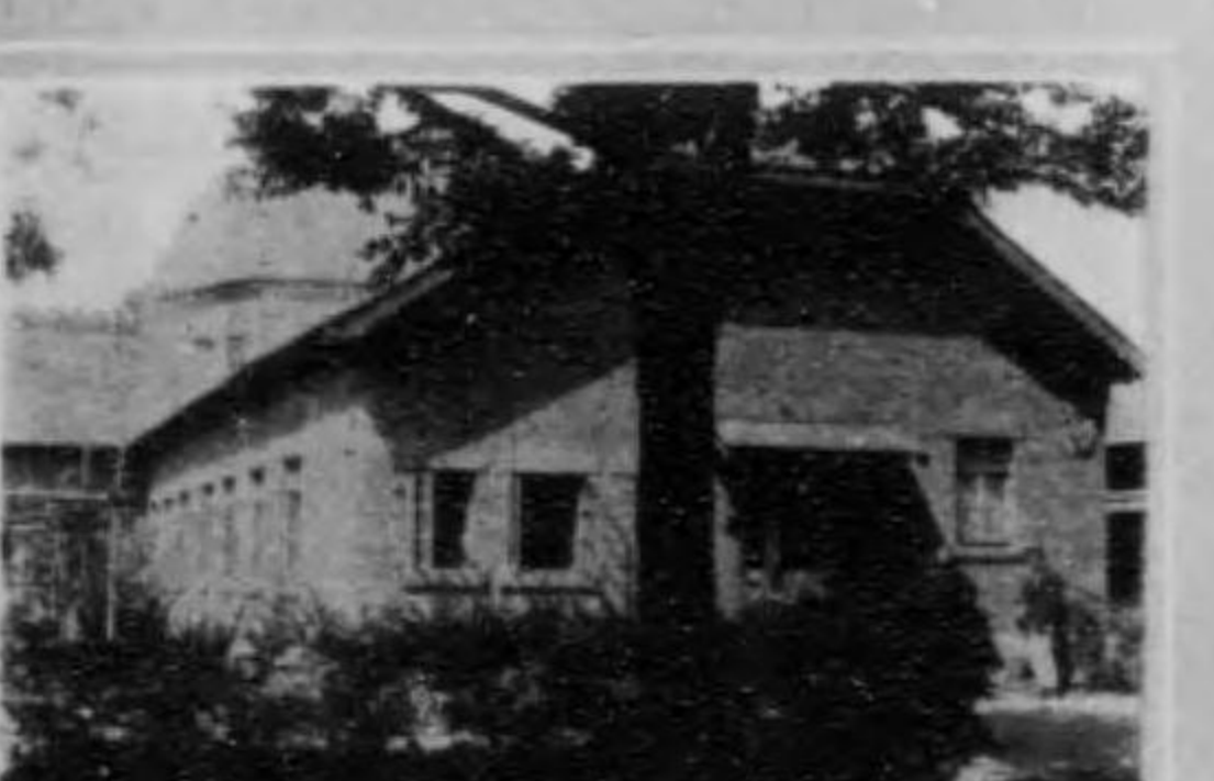
館書圖湖濱水鐵滿