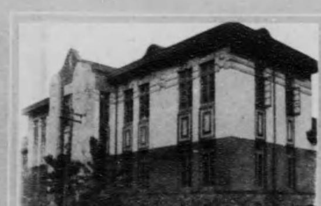
館書圖湖濱水鐵滿