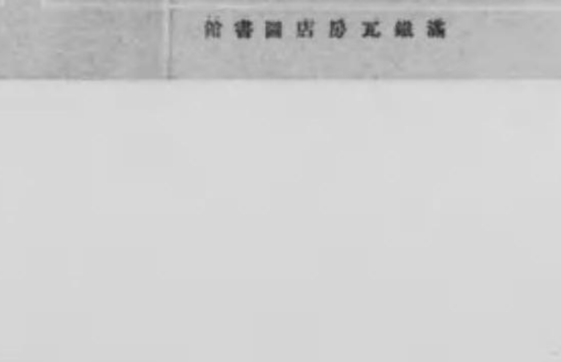
館書圖湖濱水鐵滿