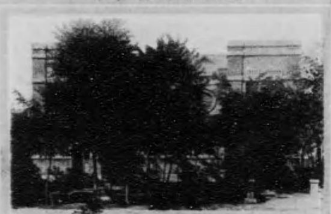
館書圖湖濱水鐵滿