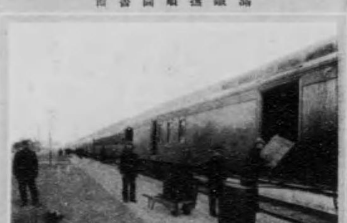
館書圖湖濱水鐵滿