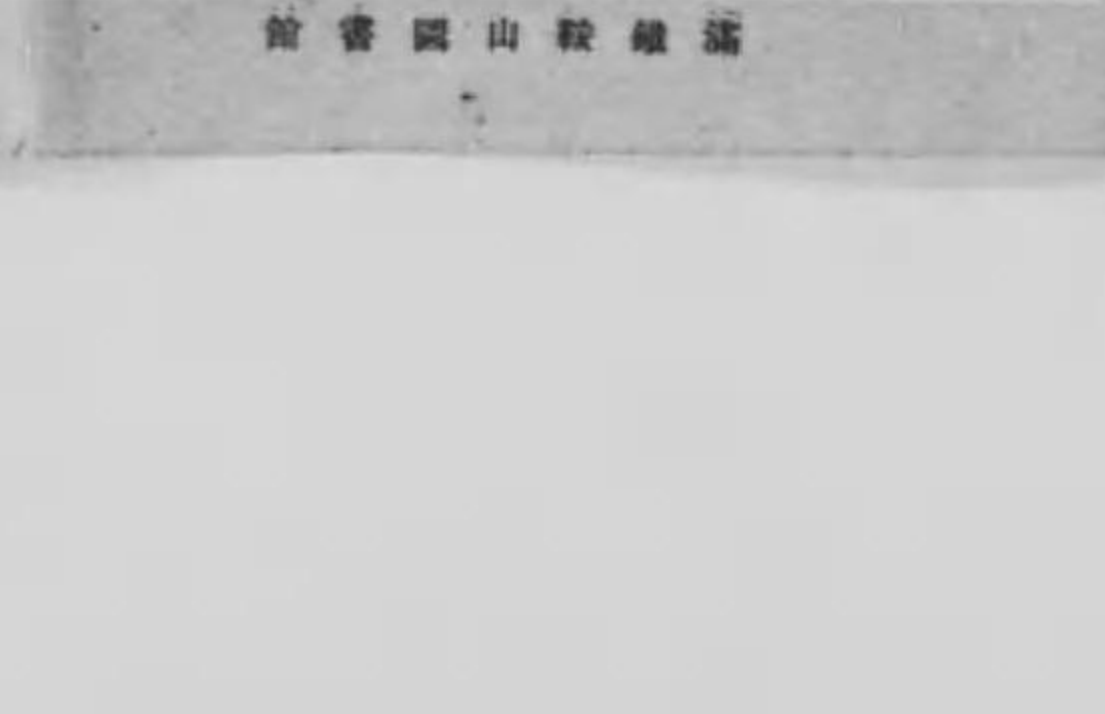
館書圖湖濱水鐵滿