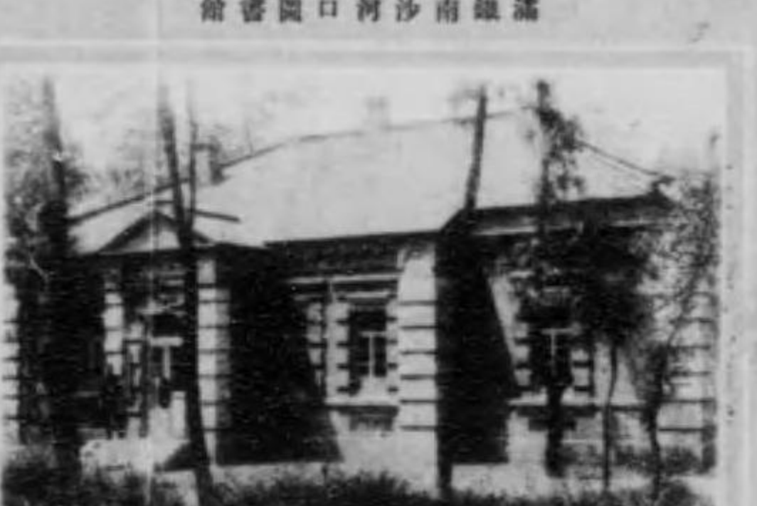
館書圖店房瓦鐵滿