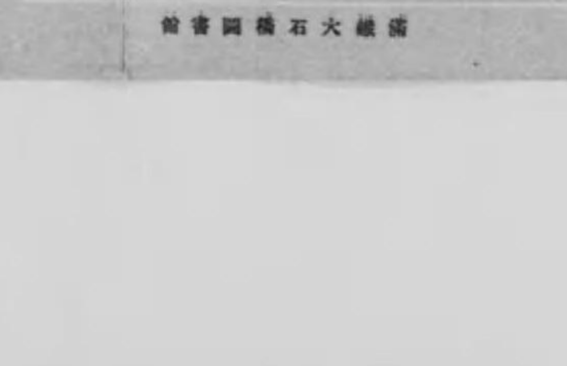
館書圖湖濱水鐵滿