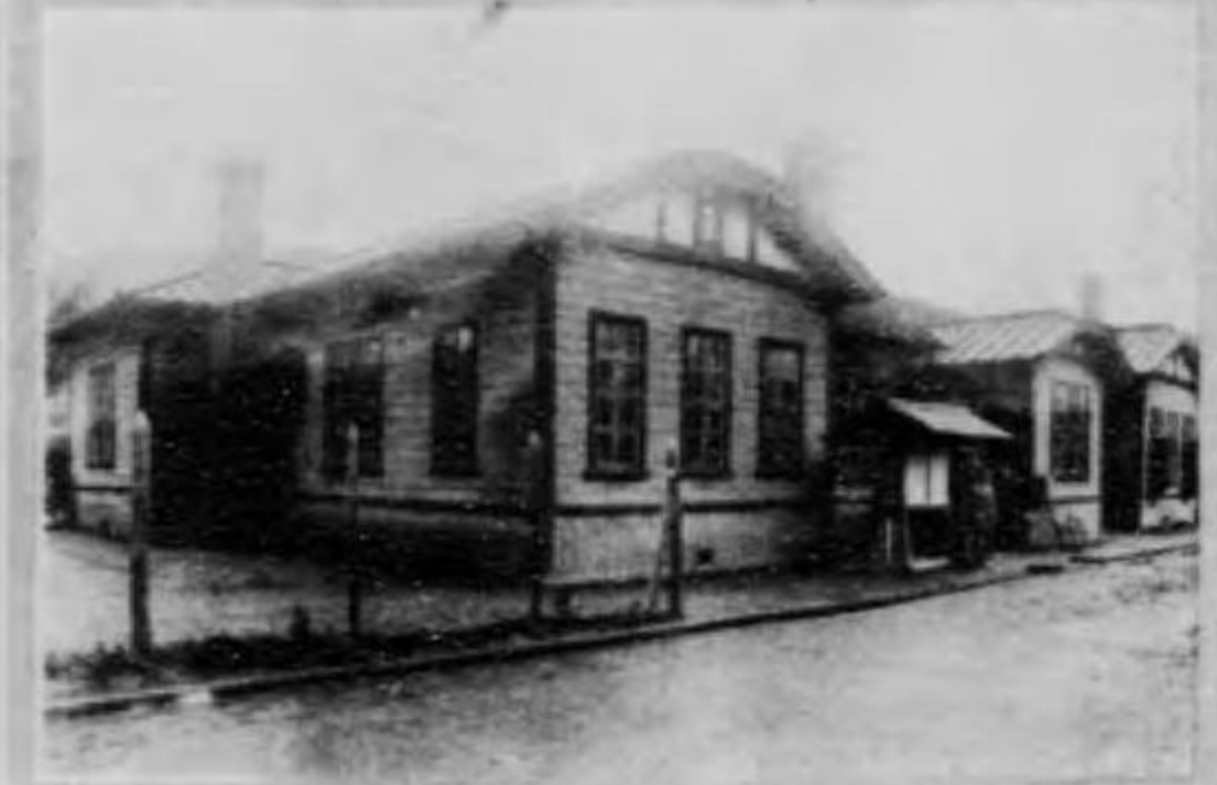
館書圖湖濱水鐵滿