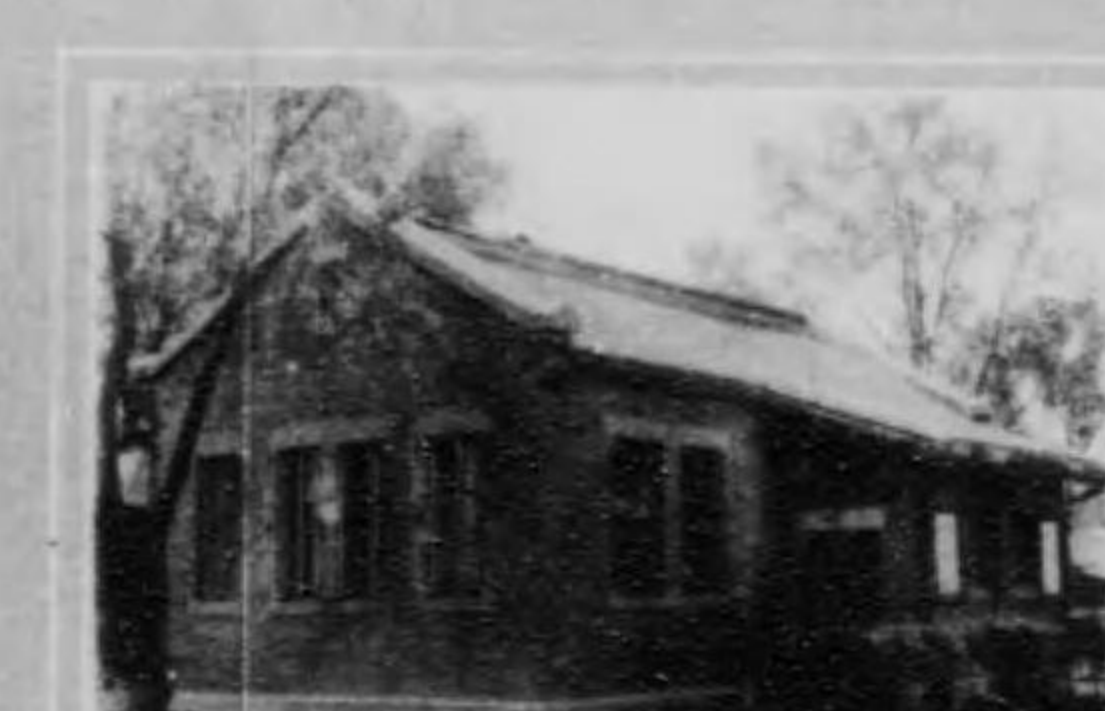
館書圖湖濱水鐵滿