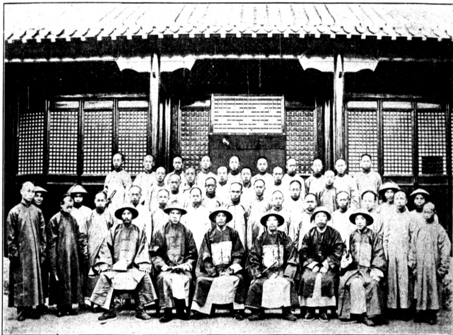
南 宮 小 學 堂