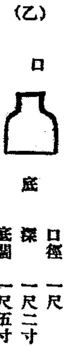
(乙) 潭溝縱斷面形 (註) 上小下大蟲入不能出