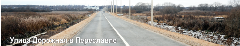
Улица Дорожная в Переславле

- В следующем году основными направлениями губернаторского проекта «Решаем вместе!» станут «Поддержка местных инициатив», «Дороги» и «Формирование современной городской среды», - сообщил заместитель председателя Правительства региона Виктор Неженец. - На последнее, согласно официальному письму Министерства строительства и ЖКХ РФ в адрес Ярославской области, запланировано выделение субсидии в размере 517 миллионов рублей. Это федеральная поддержка. Софинансирование региона должно составлять не менее 4 процентов. После принятия областного