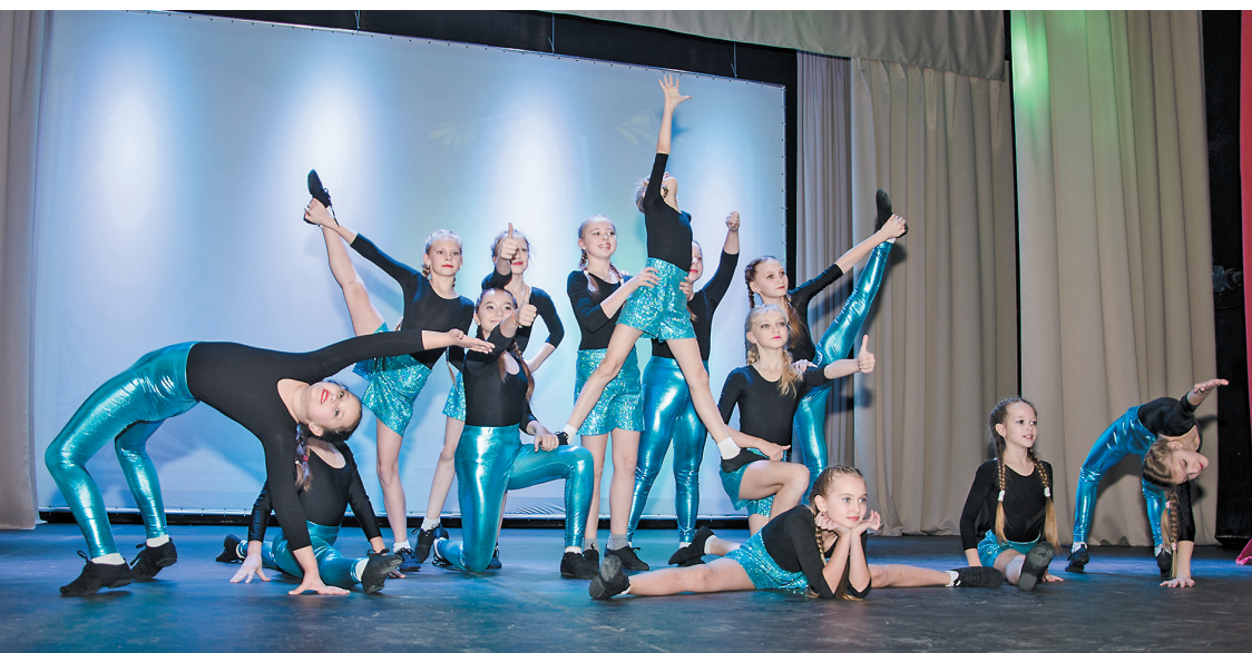
Популярные некогда пирамиды - традиции спортивных праздников сохраняются