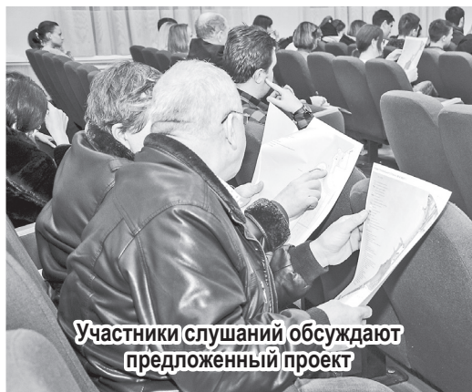
Участники слушаний обсуждают предложенный проект

Очередное обсуждение реализации проекта состоится 25 декабря в городском Доме культуры. Начало в 16 часов. Предложения принимаются по адресу: Комсомольская, 5, кабинет № 7, с 9.00 до 13.00 или на портале «Управград» - http://upravgrad.ru/