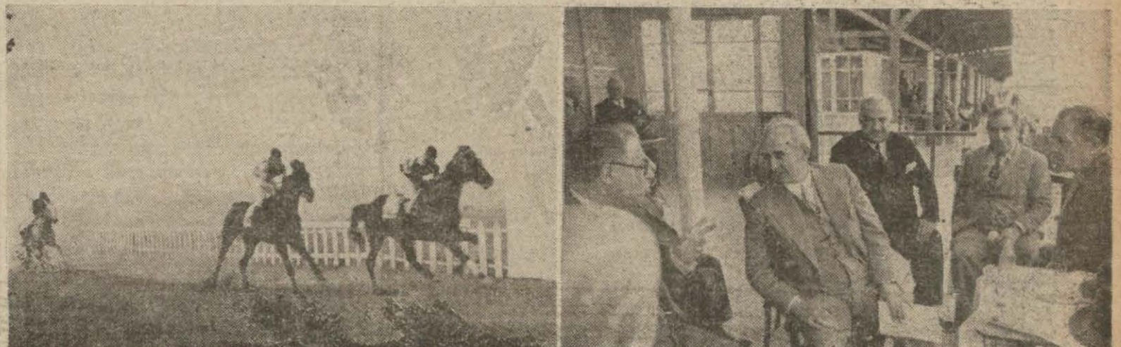
Dünkü koşulardan iki görey