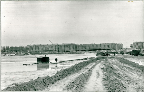
Рис.2 Карта налива № 4 на участке № 3, где производился налив. Слева видна насосная станция для перекачки осветленной воды.