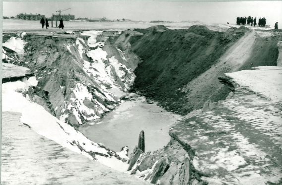
Рис.5 Правая ветвь промоины на участке № 3 и дамбе № 3 у правого берега третьего отрога Еваьего Яра.