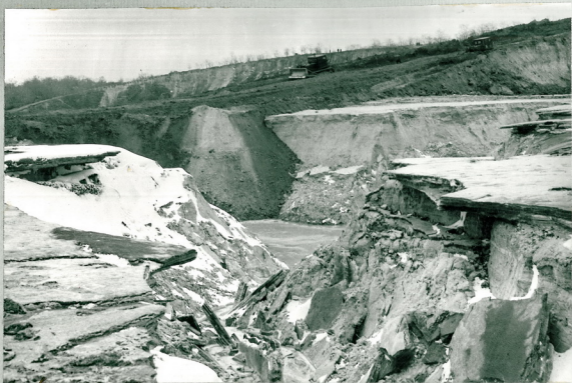
Рис.4 Левая ветвь промонии на участке № 3 и дамбе № 3 у правого берега третьего отрога Бабьего Яра.