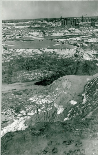
726. Рис.12 Вид с высокого правого берега на область выноса участка № 1. Сверху и в середине слева видны остатки уцелевшего участка № 1, а в середине между ними - самая глубокая часть области выноса.