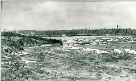
Рис.6 Зона разрушения гидроствала на участке № 2. На заднем плане видна дамба № 3, а перед ней оставался часть второго участка.