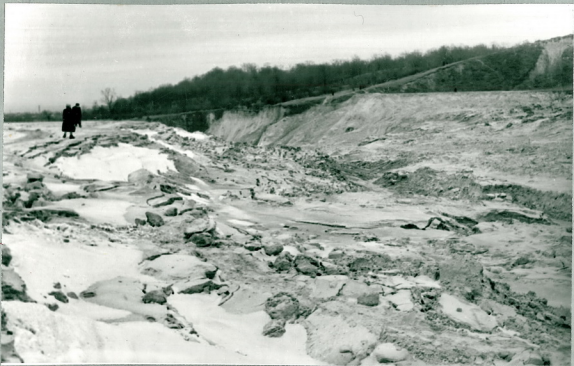
Рис. 11 Область выноса. Вид с верхней стороны.