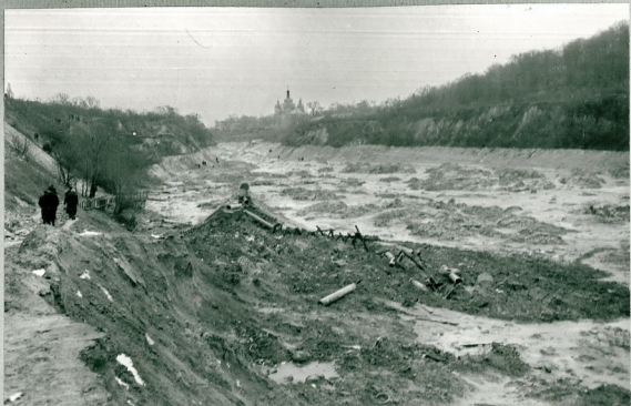
Рис. 18 Участок Бабьего Яра ниже гидроотвалов. На дне и на откосах свра- га видны следы грязевого потока.