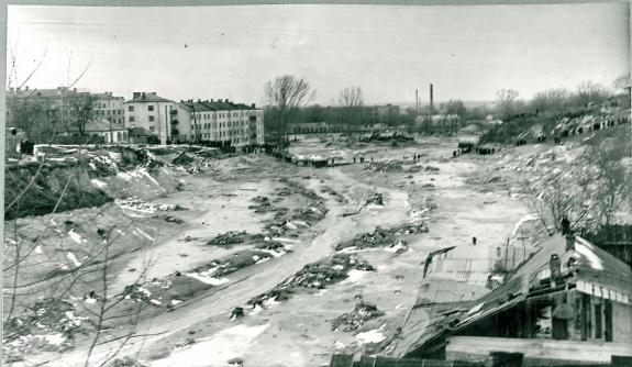
Рис.21 Участок Бабьего Яра при выходе в город. Вид в сторону города. На дне и на откосах оврага видны следы грязевого потока.