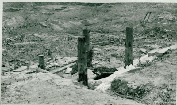
Рис. 8 Бодосбросный колодец на участке № 1