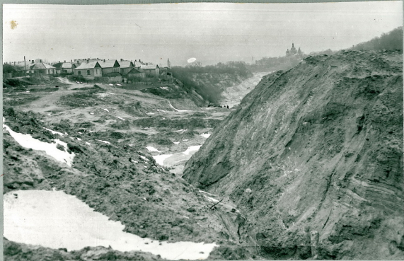
Рис. 19 Разлив и обрушение участка № 1 у примыкания к левому берегу.