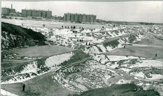
Рис. I Общий вид гидроствала. Слева видна промоина в дамбе № 3. На переднем плане - верхняя часть области выноса грунта со второго участка гидроствала.