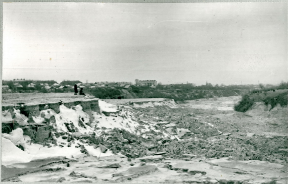
Рис.10 Левобережный откос зоны выноса на участках № 1 и № 2. На заднем плане слева видны остатки участков № 1 и № 2.