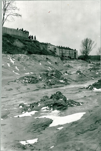
Рис.23. Участок Бабьего Яра при выходе в город. На снимке видны осевшие остатки грязевого потока.