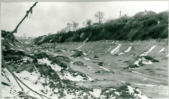
Рис.20 Участок Бабьего Яра при выходе в город. Вид со стороны города. На дне и на откосах оврага видны следы грязевого потока.