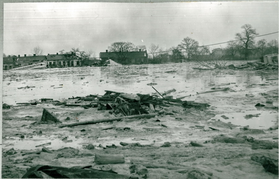
Рис.24 Улица Фрунзе со стороны города, залитая разжиженной массой грунта. Вид направо. Вдали видны опрокинутые и залитые грязевым потоком трамвай и автобус.