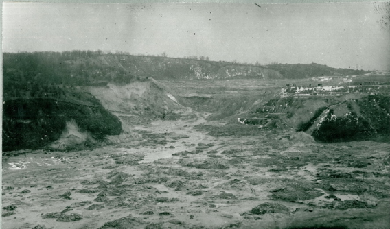
Рис. 9 Вид на разрушенный гидротвал в отроге № 3 со стороны города. Справа видна уцелевшая часть дамбы № 1, слева обрушенная часть правого берега. На переднем плане остатки грунтовой массы, вытекшей за пределы гидроствала.