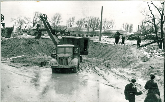
Рис.30 Вид очистного забоя от разжиженной массы грунта по улице Фрунзе со стороны города. Справа разрушенный трамвайный парк.