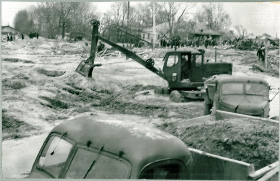
Рис. 29 Улица Фрунзе со стороны Пуши, залитая разжиженной массой грунта. Вид налево.