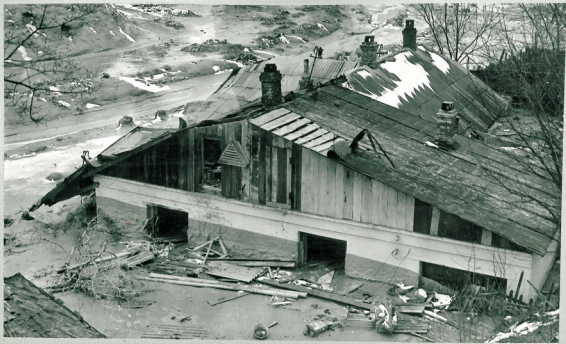
Рис.22 Участок Бабьего Яра при выходе в город. Справа виден дом, подтопленный грязевой массой.