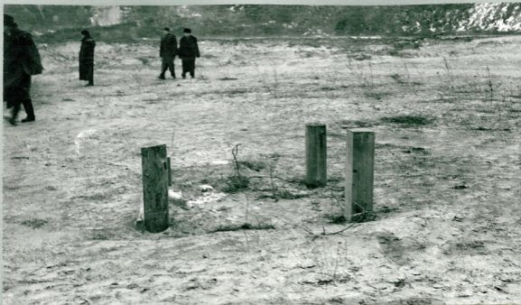
Рис.7 Заиленный сливной водосбросный колодец на участке № 2