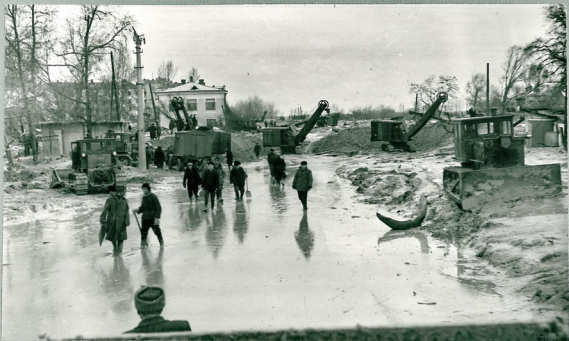
Рис. 31 Общий вид очистного забоя по улице Брунее со стороны города.