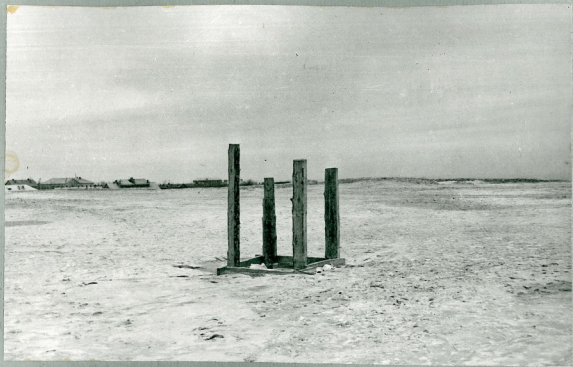
Рис.3 Колодець для слива освітленої води на участку № 3.