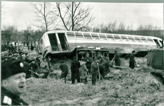
Рис.27 Улица Фрунзе со стороны Пуши, залитая разжиженной массой грунта. Вид налево.