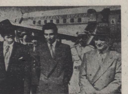
اهلیحضرت همایونی در حالیکه تیسار سپید زاهدی نخست وزیر در التزام میباشند بیانی خطاب بر رؤسای ادارات و نمایندگان طبقات مختلف که بحضور ملوکانه معرفی میشوند ایراد میفرمایند بقیه در صفحه چهارم

مسافرت هور کارشناس نفت وزارت امور خارجه امریکا بازان در تعقب مذاکرات وی با ویکتور باتلر معاون وزارت سوخت انگلستان و بدستور وزیر امور خارجه امریکا صورت گرفته است هور هیچگونه پیششهادی برای حل قضیه نفت با خود بایران نیاورد است و مسافرت او فقط برای تحقیقات و آشنائی با کلیه مسائل مربوط بخت ایران است سخنگوی وزارت خارجه امریکا اعلام کرد که هور هنگام بازگشت بامریکا در لندن توقف خواهد کرد ممکن است در کنفرانس لندن مسئله نفت ایران مطرح گردد