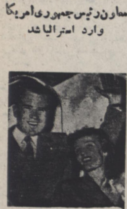
معاون رئیس جمهوری امریکا وارد استرالیا شد

روز دوشنبه آینه دنیای میثود قاهره - جهان عبدالناصر معاون نخست وزیر مصر اعلام کرد که جلسه آینه کنفرانس نایبندگان مصر که در آن بمسئله کانال سوئز رسیدگی میشود روز دوشنبه آینه در قاهره تشکیل خواهد شد و در آن نظر انگلیس و مصر را معراج برنوش منطقه کانال سوئز توجه تخلیه این منطقه از طرف سر بازان انگلیس تأیید بر طرف نشده است.