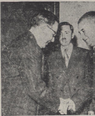
آقای انتظام وزیر امور خارجه تولد پادشاه افغانستان را بکاردار سفارت افغان در ایران تبریک میگوید بنیاسبت روز تولد اعلیحضرت محمد ظاهر شاه پادشاه افغانستان پریش مجلس شایخی در محل سفارت کبرای افغانستان برپا بود. در این شبانیات چند تن از آقایان وزیران و نمایندگان مجلس شور او ستوانی نمایندگان سیاسی کشور های خارجی مقیم تهران و مدیران روزنامه ها با یونان حضور داشتند از طرف آقایان کاردار و اعضای سفارت افغانستان از مدمومین پذیرائی بعمل آمد