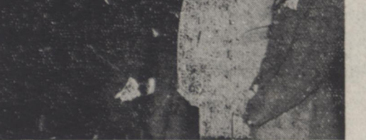
در موقع نزول اجلال موکب اعلیحضرت همایونی و اعلیحضرت ملکه تریا در فرودگاه اصفهان دوشیزه ای دست کلی بلیاحضرت ملکه تقدیم نمود و خطابه ای مبنی بر خیر مقدم و ابراز مراتب خشنودی و مسرت قاطبه مردم اصفهان از شریف فرمائی بپوش رسانید

وزیر کشاورزی گزارش مختصری بعرض رسانید و مدیر عامل بنگاه آبیاری ضمن گزارش مفصل خود جزئیات عملیات ساختمانی کوهر کت و نتایج حاصله از آن را معروض داشت. شاهنشاهی سد کوهر کت را افتتاح فرمودند و از تاسیسات کوهر کت بازدید کردند جشن سالیانه نیروی هوایی بمذاظر امروز در فرودگاه اصفهان در پیشگاه اعلیحضرت همایونی برگزار گردید