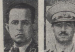
سر تیپ بهشتیار سر تیپ افشار پور امروز هم آقای سر لشکر مقبلی که بجای آقای سر لشکر افشاری بریاست دادگاه بدوی نظامی انتخاب شده است در دادگاه حاضر شد. غیرتکار ما برای اطلاع از مهلت هم حضور وی در دادگاه ملاقات او رفت.

مشاور غیر نظامی در مورد انتشار يك نمراد میلیون ریال اسکناس جدید و اقداماتی که تاکنون از طرف بانک ملی در جهت نظارت اندوخته اسکناس صورت گرفته اظهار داشت: پس از مطالعاتی که در مورد تقاضای دولت مبنی بر انتشار یکصد میلیون ریال اسکناس جدید از طرف هیئت نظارت اندوخته اسکناس و همچنین سایر مراجع صلاحیتدار بعمل آمده هیئت نظارت اندوخته اسکناس مرکب از آقایان دکتر امینی وزیر دارایی نماینده دولت سید احمد امامی دادستان کل، حسین مکی و احدی فرامرزی نمایندگان مجلس خود ریالی، جهانگیر بازرسی دولت و یاقریزیا کلید خاخره داری کل موافقت کرد در مقابل ده میلیون دلار که امریکا بوزارت دارایی مبلغ سی و دو میلیون پانصد هزار ریال در اختیار دولت قرار دهد. این ۱۰ میلیون دلار که از قرار ۸۳۷۰۰۰ ریال در اختیار وزارت دارایی گذاشته شده از قرار دلاری بقیه در صفحه دوم