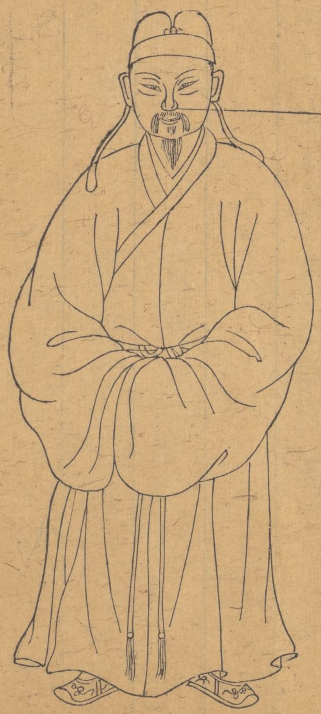
鼻瘡鼻痔浸淫破爛俱生鼻孔難以圖畫