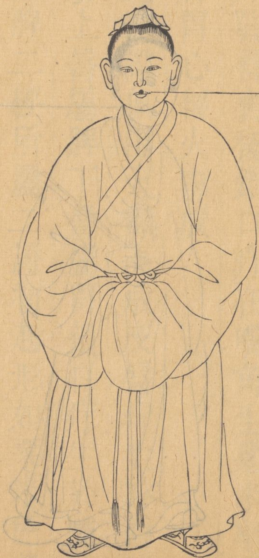
反唇疔上下唇皆同