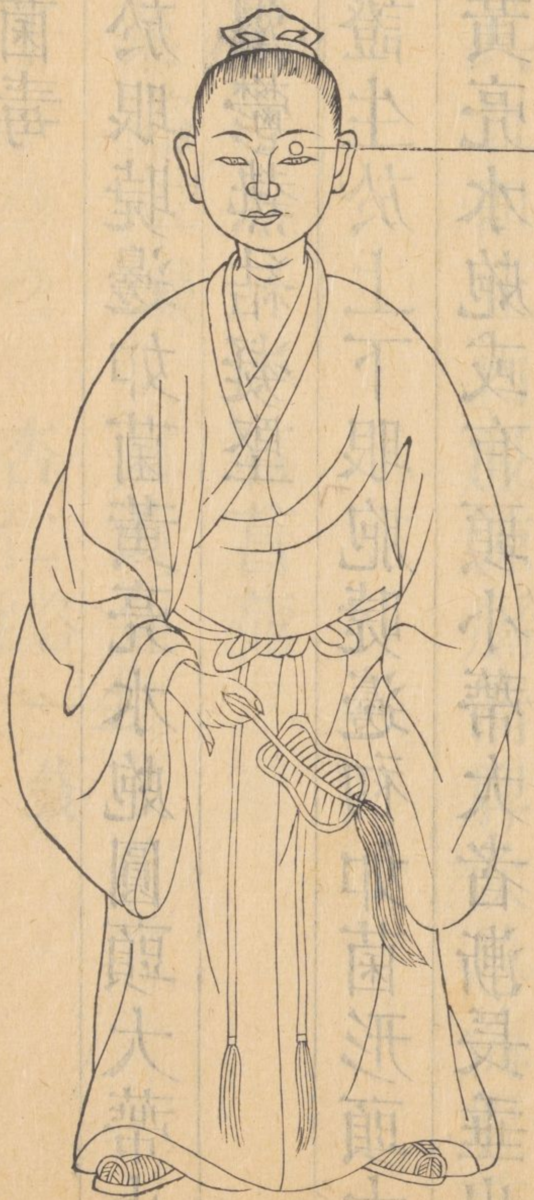
菌毒生於眼胞邊形如黃皂水胞日久如菌形