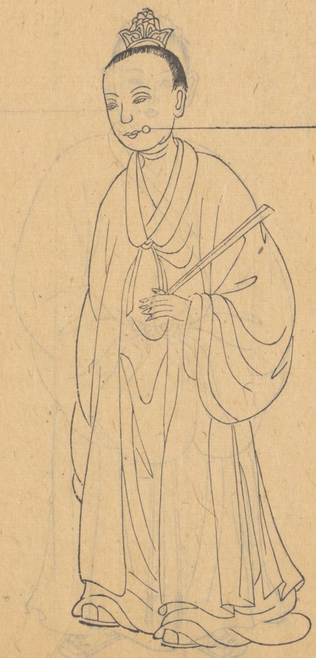
鎖口疔生在口角左右同