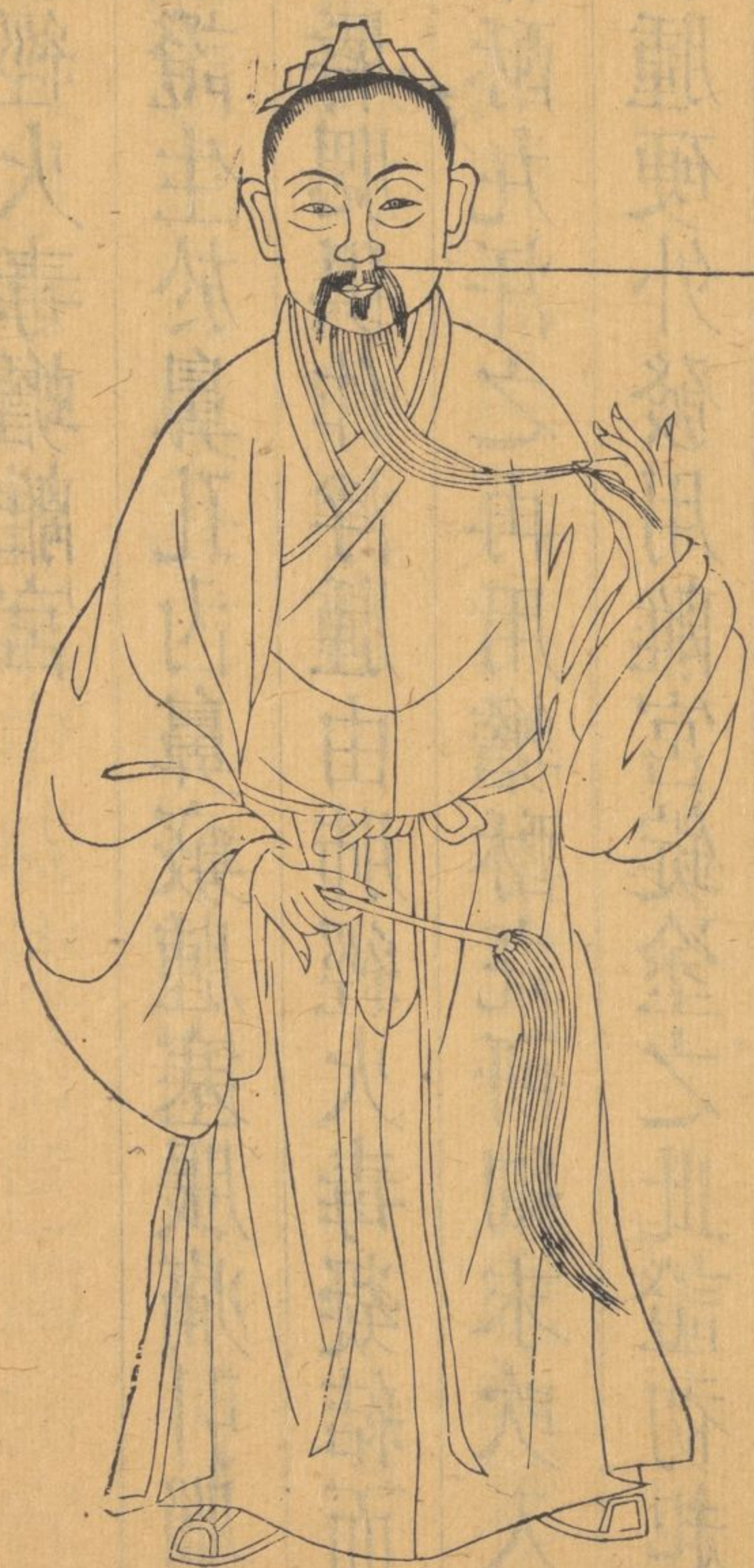
鼻疔生在鼻孔之內焮痛異常