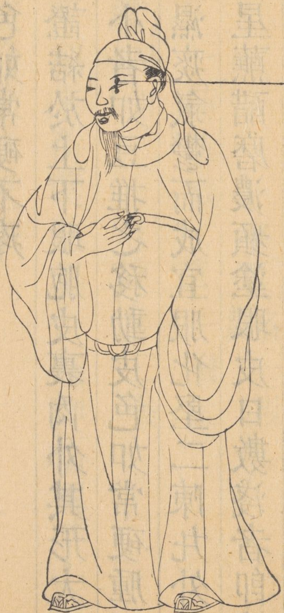
痰核生於眼上下胞含於皮裏皮色如常