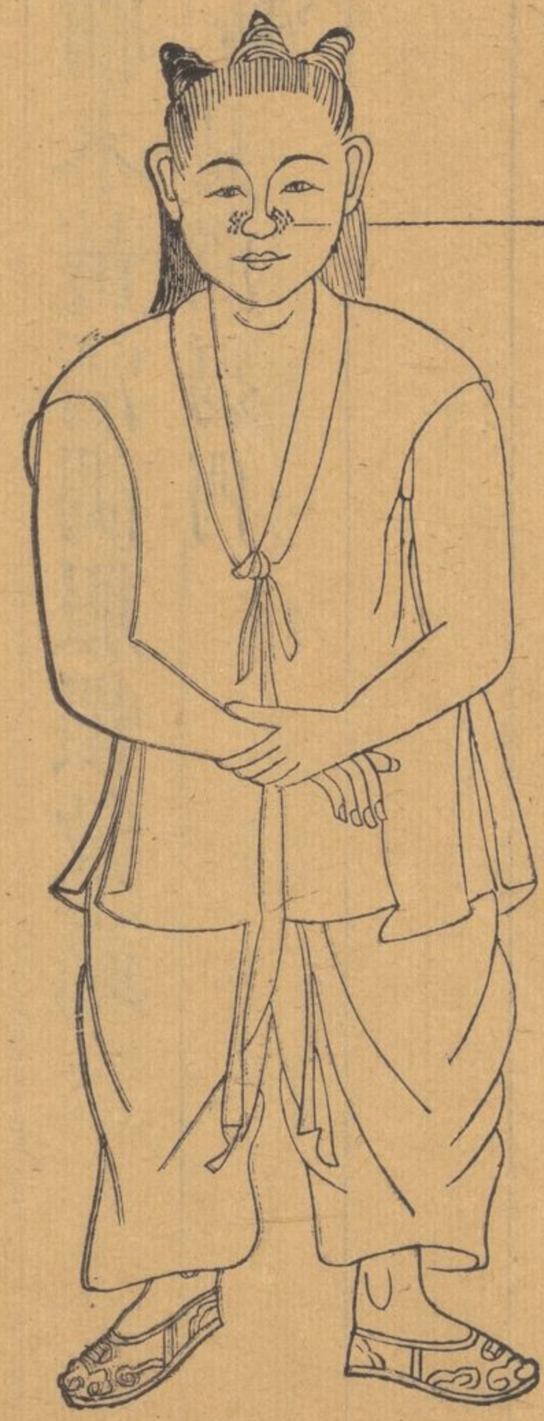
鼻蠱瘡多生小兒鼻翅及兩傍