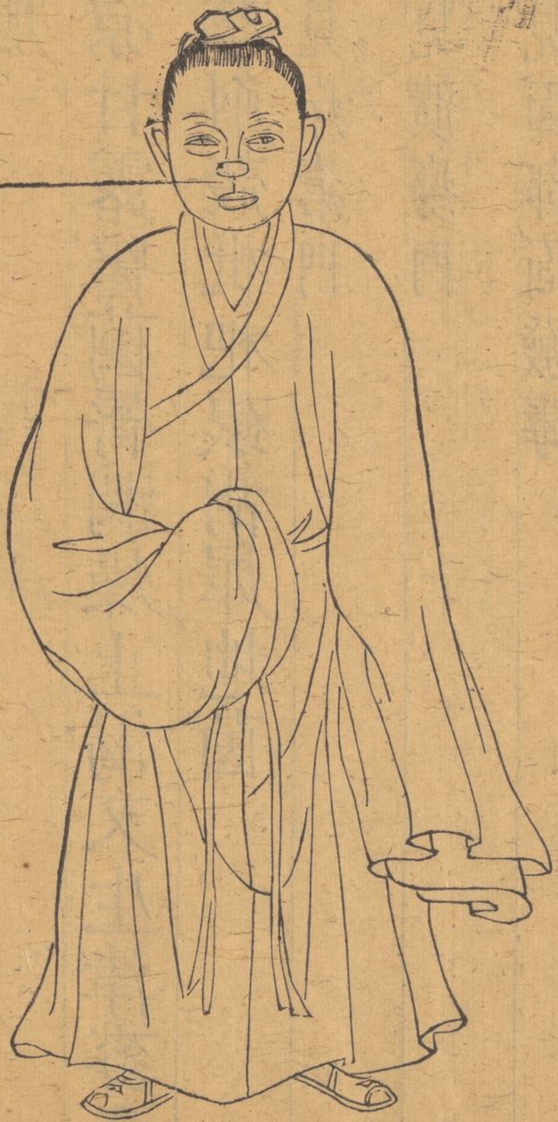
唇風生在唇上下皆同