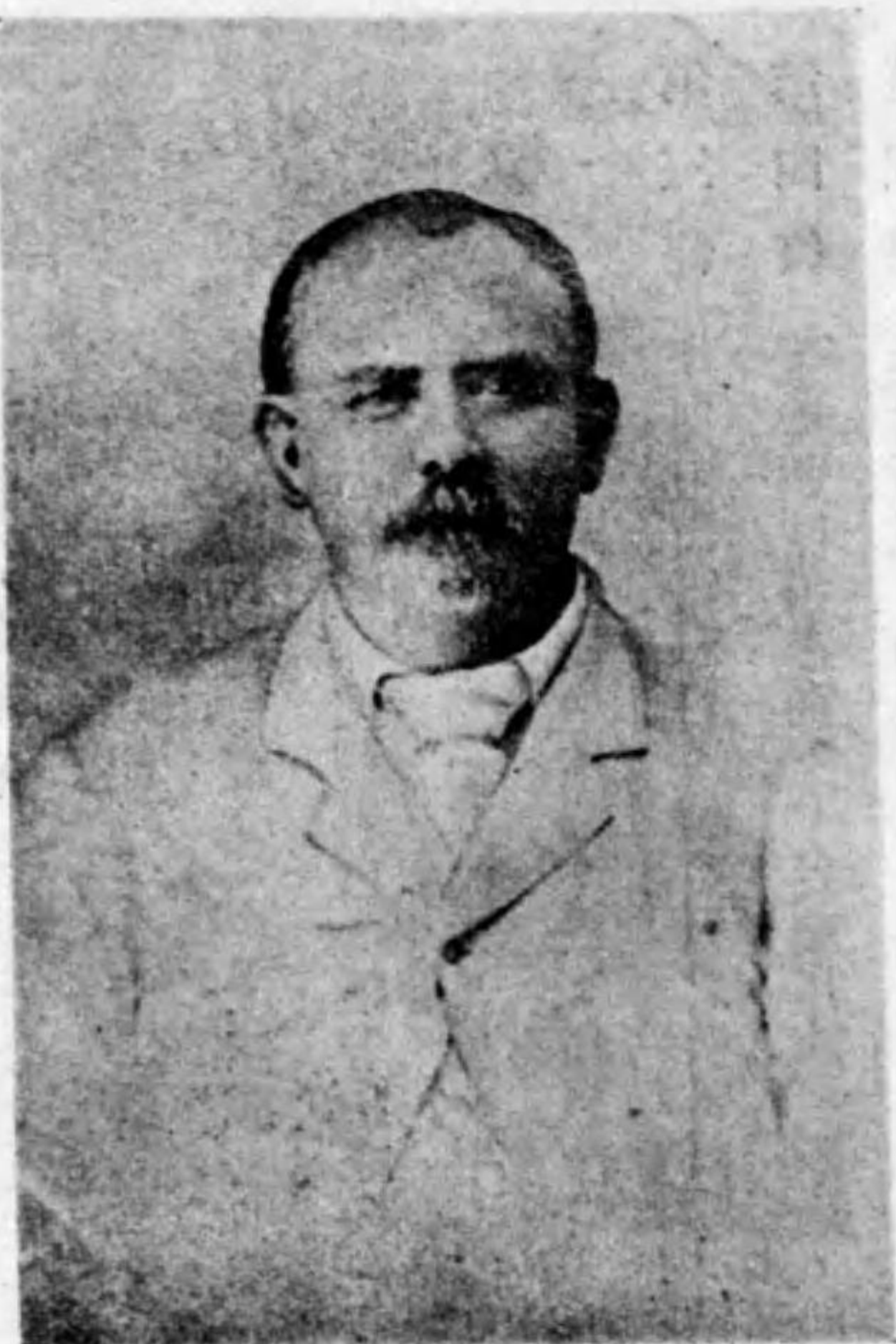
スノーゼ・ルエ・ルエ

斯くして明治四年七月米國の非役士官陸軍大尉エル・エル・ヂェーンヌ來朝し、野々口は之を東京に迎へ、藩廳との契約書を交換して熊本に伴ひ歸つた。そして同教師の意見などにより準備を急ぎ愈々九月開校といふことになつた。