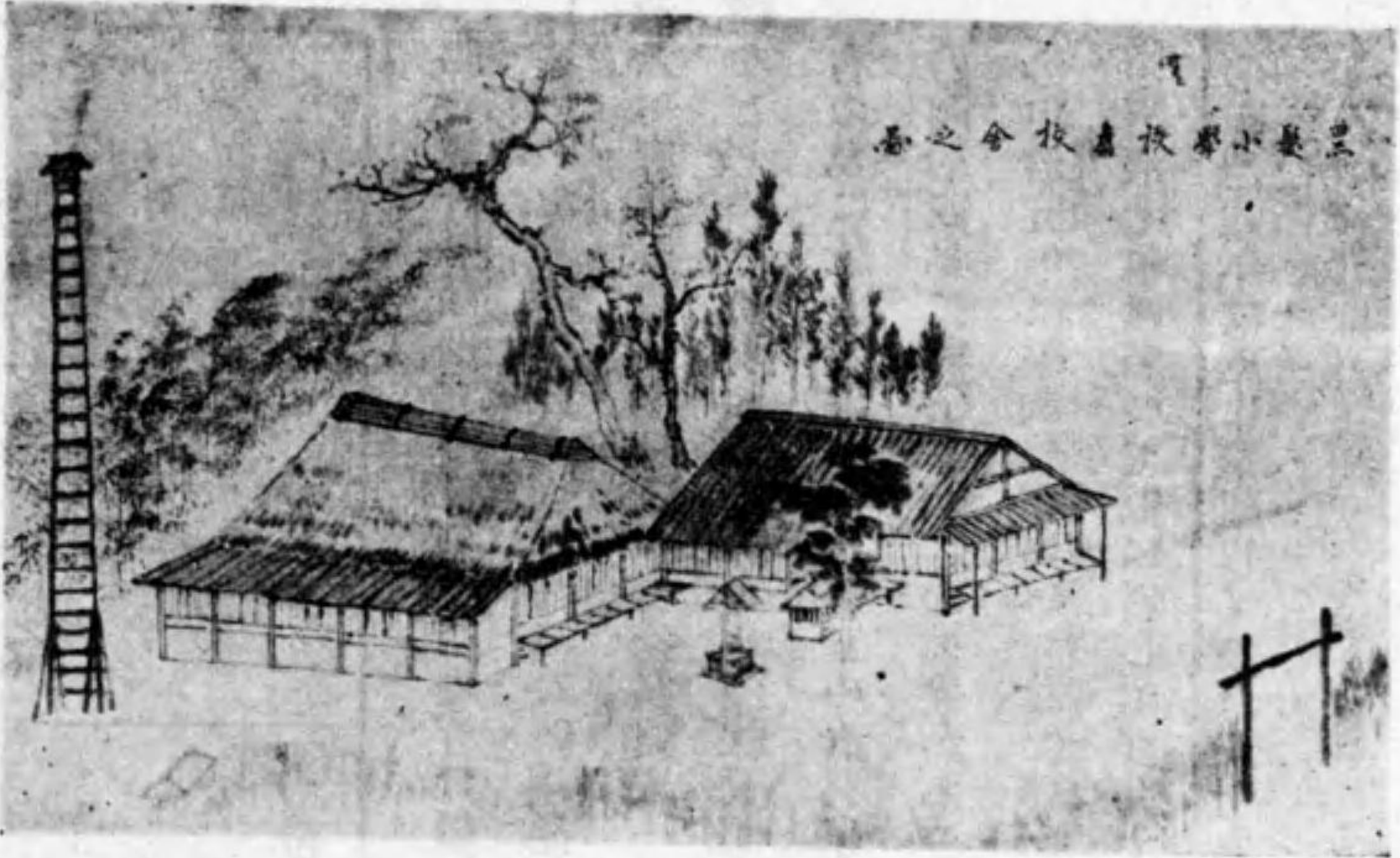
黒髮小學校舊校舍

して、今一息といふ所で、十年の役となり、其の年僅か十四校の設立を見る様な一頓坐を來してゐる。次二ヶ年で七十校の新設となつて愈明治十二年には六百六十五校の普及状態となつたのである。