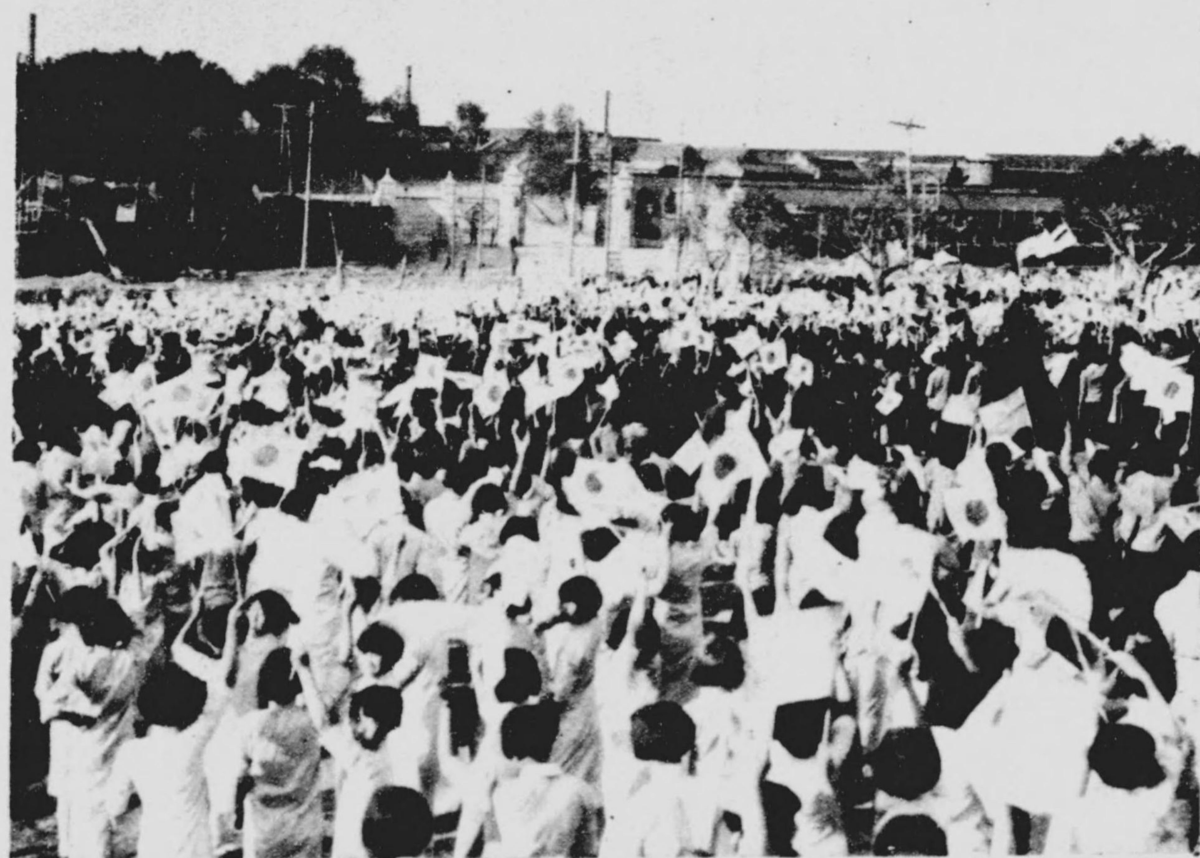
宮内府前ノ慶祝行列