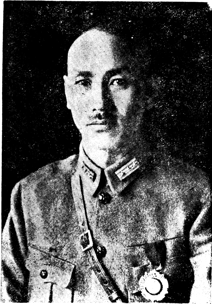
蔣 委 員 長