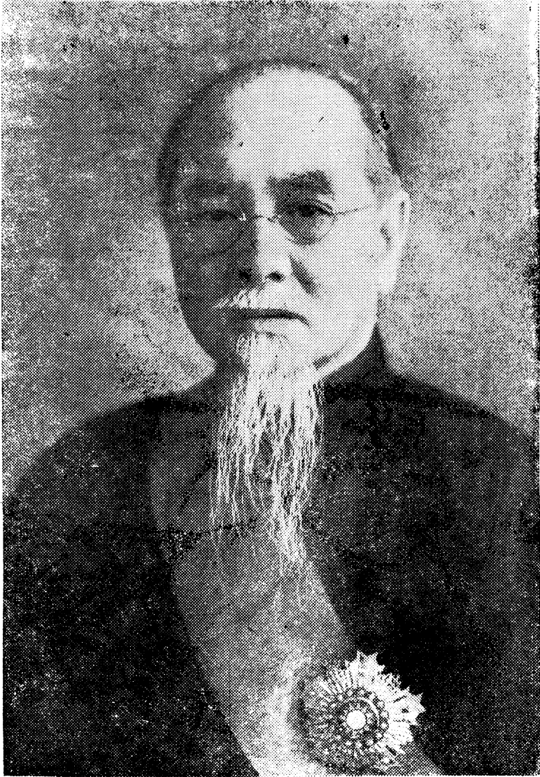
林 主 席