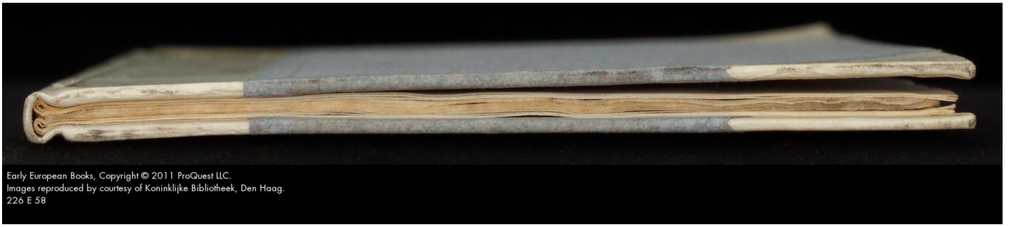
226 E 58