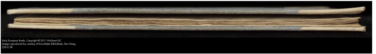
Early European Books, Copyright © 2011 ProQuest LLC. Images reproduced by courtesy of Koninklijke Bibliotheek, Den Haag. Z20 E 58