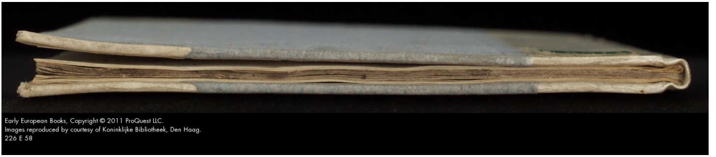
Early European Books, Copyright © 2011 ProQuest LLC. Images reproduced by courtesy of Koninklijke Bibliotheek, Den Haag. 226 E 58