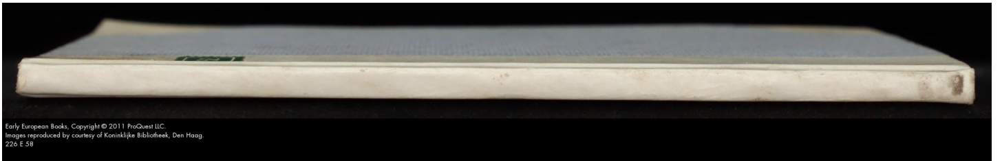
226 E 38