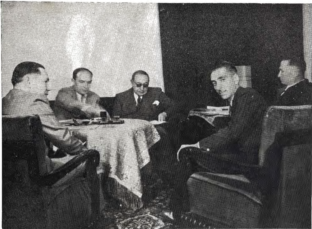
جناب اشرف آقای نخست وزیر و جناب آقای سفیر کبیر اتحاد جماهیر شوروی هنگام امضاء اعلامیه مشترک