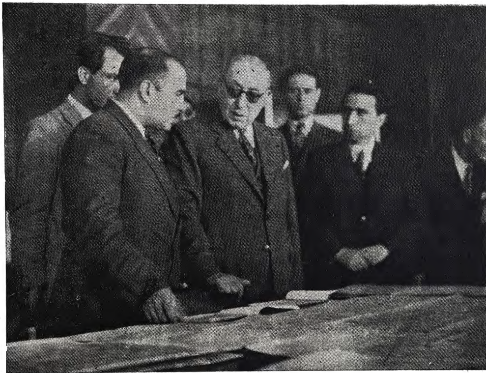
جناب اشرف آقای نخست وزیر هنگام بازدید کاخ دادگستری