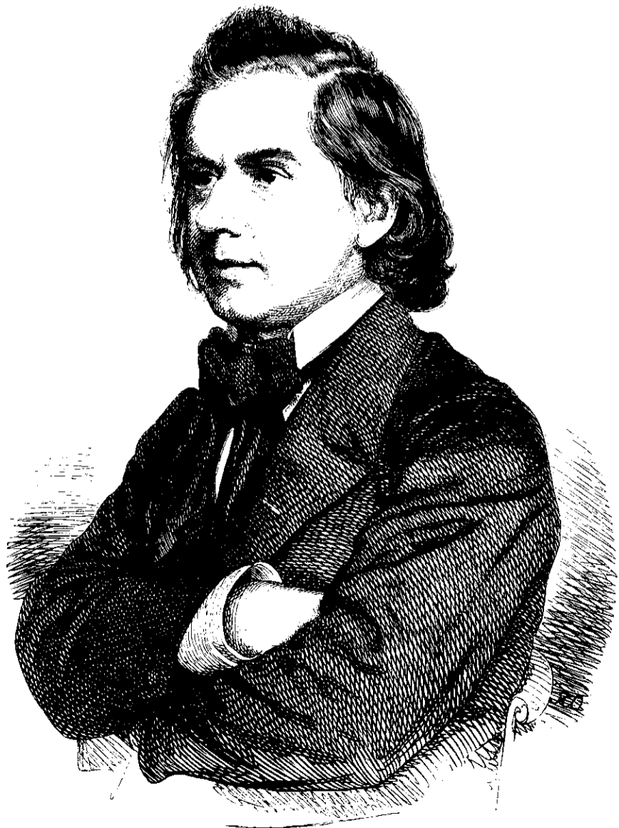
Niels Wilhelm Gade.

de kunne ikke tænkes borte, uden at et Gul vilde fremkomme i den musikalske Literatur, som kun Gade kunde udfylde. Charakteren i dem er nordist, men Kraften er i lige Grad parret med Ynde, og af sjælsfulde, inderlige Partier er der nok. Naar man derfor tænker ikke blot paa de kraftige Allegro-Motiver, men ogsaa paa Andante-Stykkerne, paa Comalas Parti og Andet i lignende Stil, kan man neppe forstaae Tidsfærens megen Stikken i hin Tid paa Gades Nordisthed. Alle hine Toner vare Gade naturligt medfødte, og at forekaste ham deres Eiendommelighed er ligesaa urigtigt, som at bebrejde Drosken, at den ikke quidder som en Lærke. Overhovedet er der trods det indbyrdes Slægtskab i alle Værkerne fra hin Periode dog Rigdom og Stof nok til at kunne variere og afføde nye i stadig Stigning et heelt Liv igjennem. Imidlertid fremkom den fjerde Symfoni i B, der paa en glimrende Maade viste, at Gade var i Stand til — om ikke at „kaste sin Originalitet bort“ — saa dog til at opgive en Deel af den og alligevel vinde ny Interesse. Et lettere,