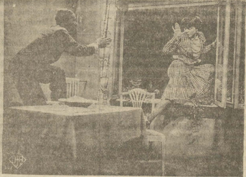
Dolly Haas 'Kuyruklu yıldız' da