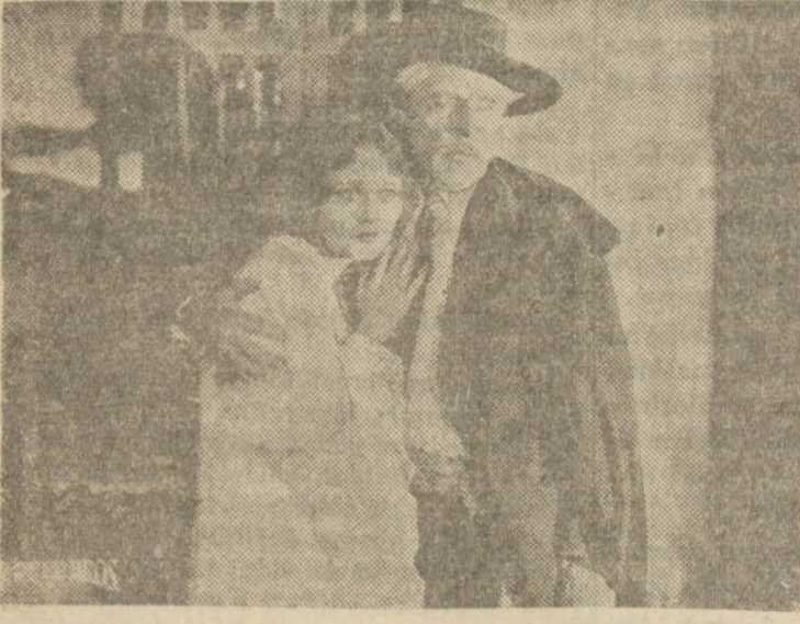
'Cehennemler Hâkimi'nden bir sahne

Bu haftaki filimlerde beynelmilelik hâkimdir. Muhtelif sinemalarda Amerikan, Alman, Fransız ve Yunan kordelâları gösteriliyor