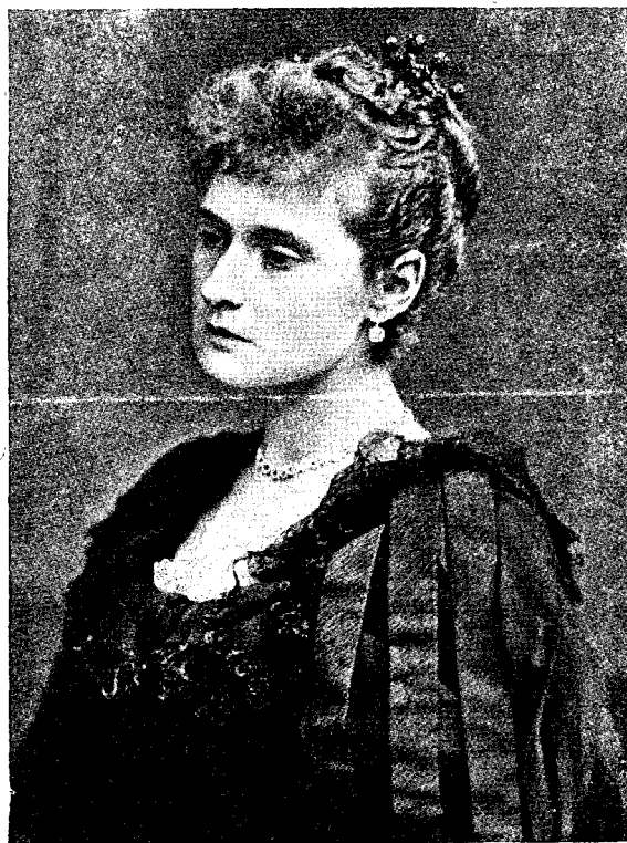
T a r i n a.

„Așa grăește Domnul! Toți călugării trebuie de-acuma înainte să se insoare, căci un bărbat neînsurat e ca și un pom neroditor, care nu e bun de nimică alta, fără numai de tăiat și de aruncat în