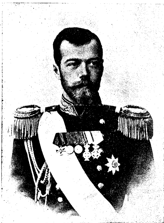
Ț a r u l.

Într'o zi înse, prinzând Scaraoțchi de veste că dracul, ce-a voit să facă pe creștini ca să păcătuiască, nu i-a adus încă nici un singur suflet, s'a mâniat așa de tare pe dânșul, că puțin ce-a lipsit de nu l-a făcut hăbuc. A spus adică tuturor celorlalți draci ca să se stringă la un loc și apoi le-a poruncit ca să-l biciuiască cu biciuri de foc până ce nu va vedeai bine pentru că nu i-a împlinit porunca, ci a umblat numai... iac' așa... de frunza frâsinelului prin lume.