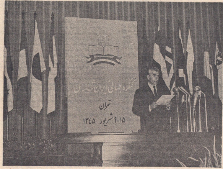
نهم شهریور ۱۳۴۵ - شاهنشاه آریامهر با ایراد پیام خوش گنگره ایرانشناسان جهان را افتتاح فرمودند