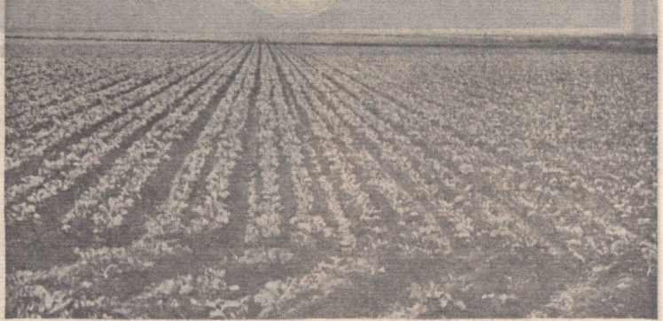
مزرعه چغندر قند