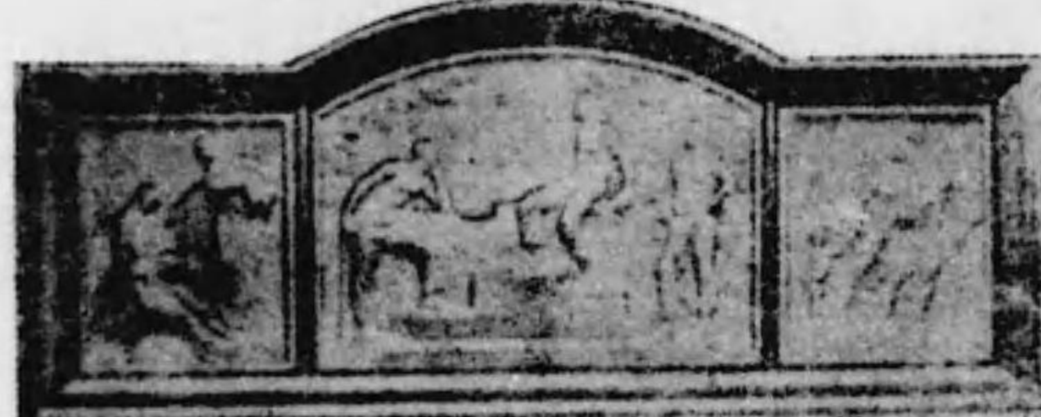
（製刷寸八尺一横寸八サ高）碑念記興復部帝

感謝狀 東京新炭商報社 大正十二年九月一日關東地方、 大震火災、方、協心協力、救護 並、善後、措置、盡瘁、帝都復興ノ 基礎ヲル諸般ノ施設計畫上貢獻 ニナル所、勤勞ノ全、帝都復興ノ 事業ハ所期ノ目的ヲ達成、其ノ 完了、告、茲、帝都復興記念碑、 贈呈、感謝ノ意、表ス 昭和八年九月一日 帝都復興記念碑建設委員会