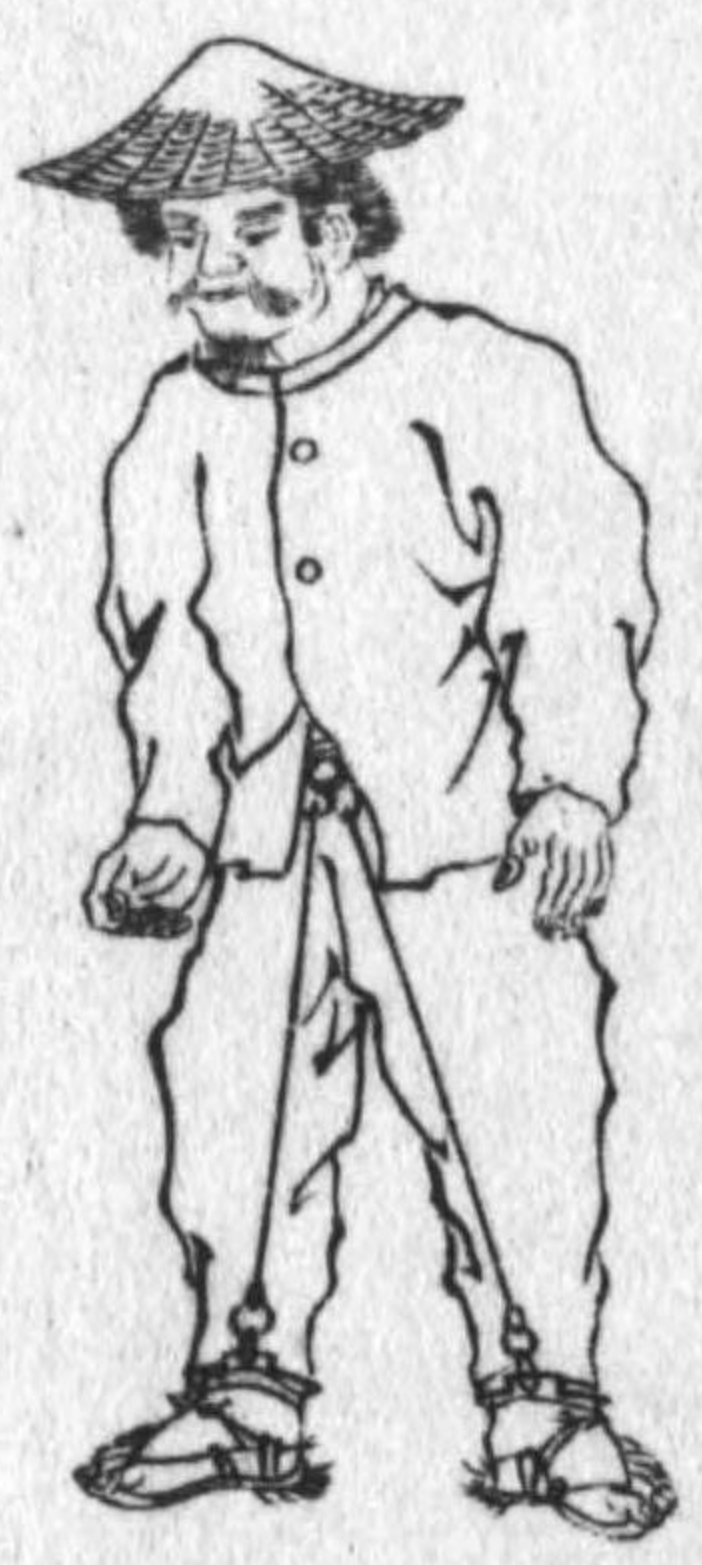
○此ノ如キ難形ノ鐵輪ノ帶綱 トノ間ニ封印ヲ為ス