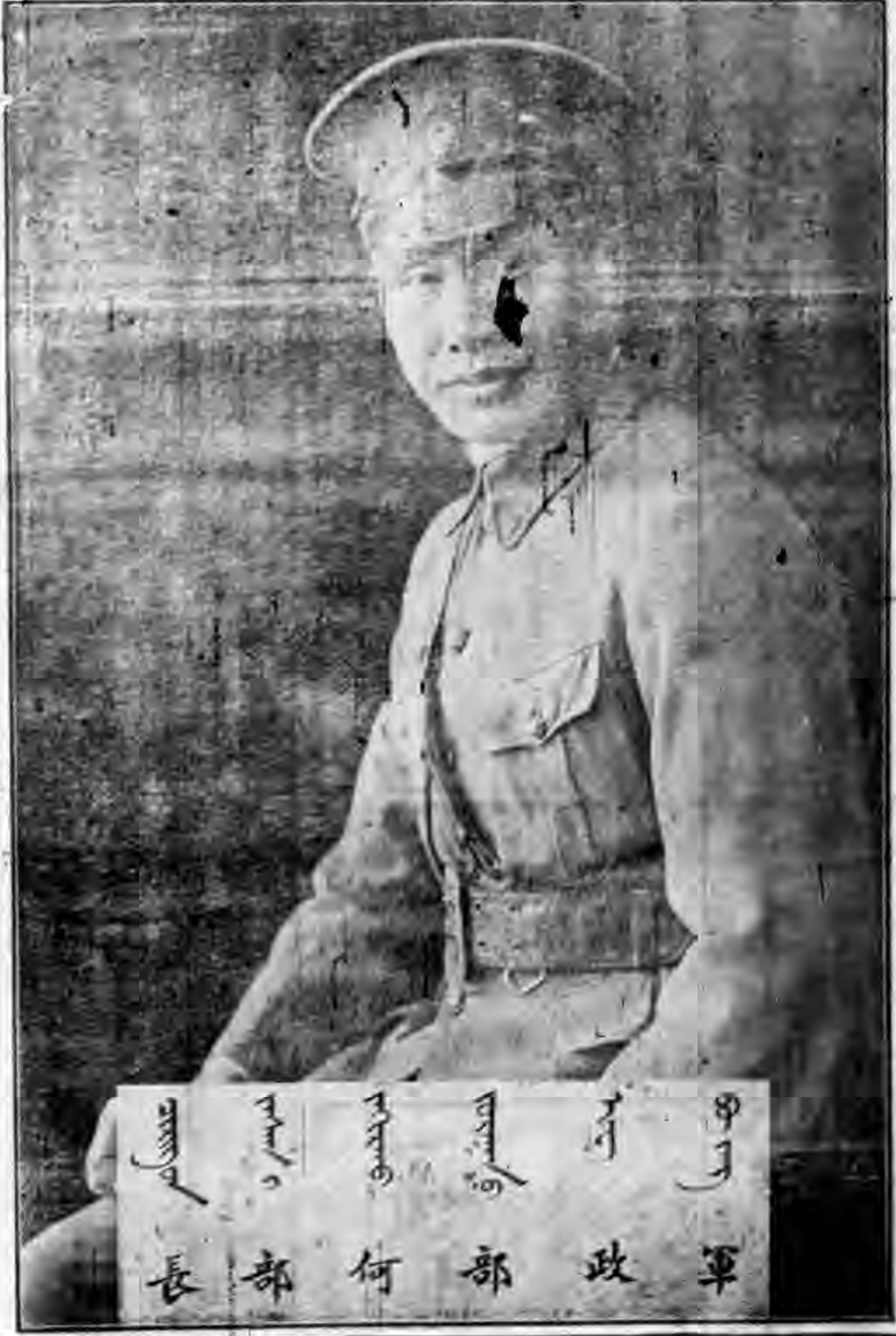
軍政部 何部 政軍

人民，自從憲法頒行之後，幾乎眾口一詞，說美國的憲法是世界中最好的，就是美國政治家，也說自有世界以來，祇有美國的三權憲法，是一樣很完全的憲法，但是依兄弟詳細的研究，和從憲法史乘及政治學理種種方面比較起來，美國的三權憲法，到底是怎麼樣呢，由兄弟研究的結果，覺得美國憲法裏頭，不完備的地方還是很多，而且流弊也很不少以後歐美學者研究美國憲法所得的感想，也有許多是和我相同的，兄弟以最高的眼光同最崇拜的心理去研究美國憲法，到底美國憲法是有不完備的地方，就是近來關於美國憲法裏頭，所有不完備和運用不靈敏的地方，世人也是漸漸的知道了，由此可見無論甚麼東西，在一二百年之前，以為是很好的，過了多少時候，以至於現在，便覺得不好了，兄弟研究美國憲法之後，便想要補救他的缺點，當時美國學者也有這種心理，想要設法補救的，但是講到補救的事，談何容易，到底要用甚麼方法才能補救呢，理論上固然是沒有這樣書籍可以作補救，事實上沒有甚麼先例可以供參考，研究到這裏，兄弟想起從前美國哥倫比亞大學，有一位教授叫做喜斯羅，化著了一本書叫做「自由，一