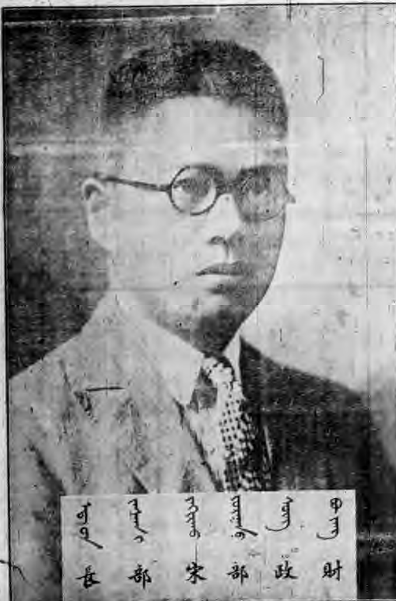
財政部 宋部 政財