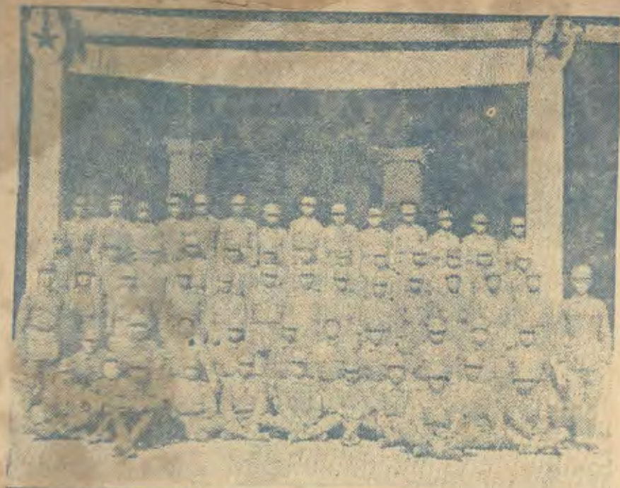
教導總隊學習人員之一部