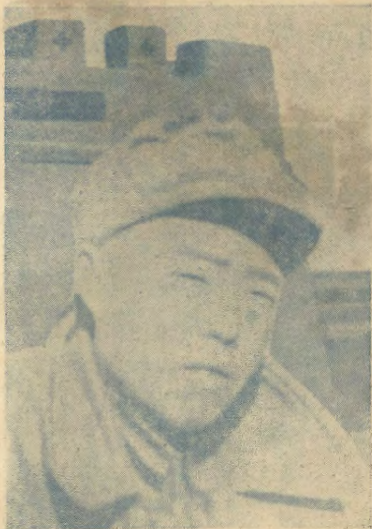
英 項 長 軍 副