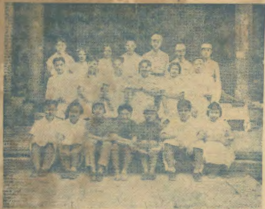
→ 醫務主任與日本倅廣