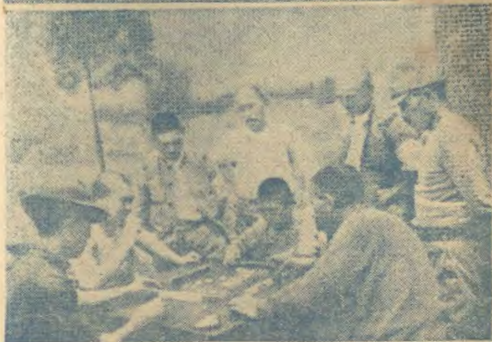
逐角的好漢與軍皇 (一之片照獲繳軍四新)