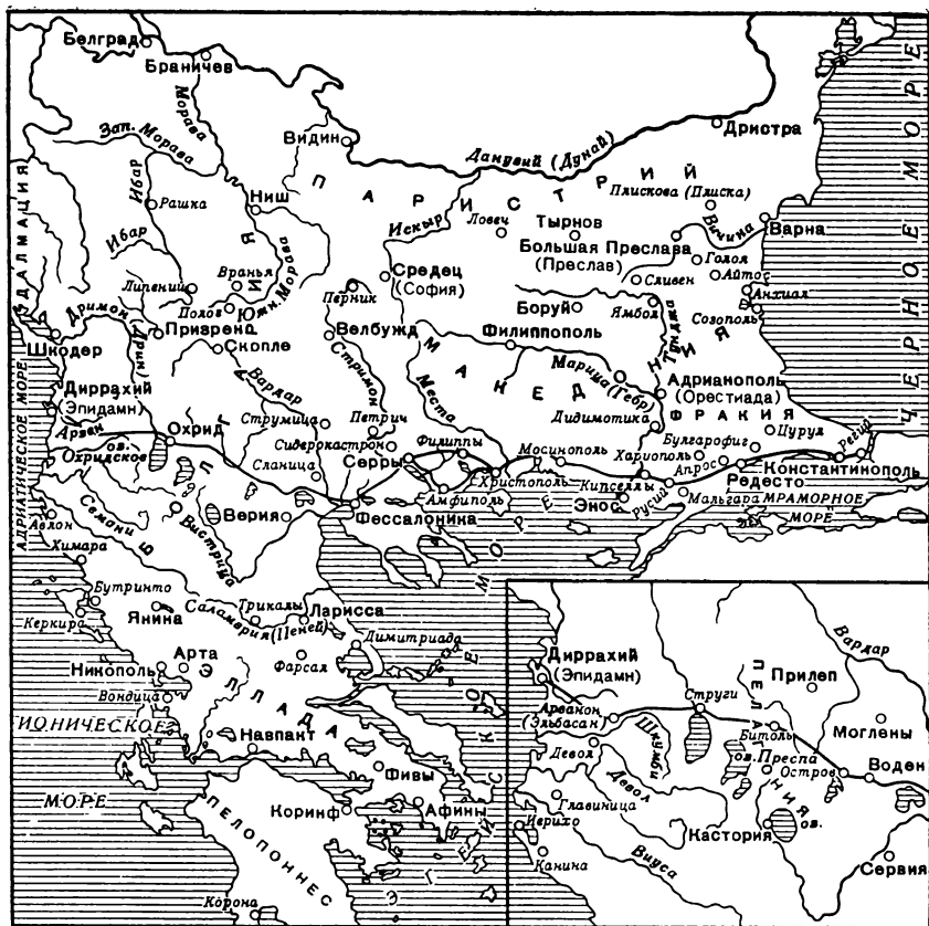
Балканский полуостров в конце XI—первой половине XII в.

дара пророчества, он много и часто предсказывал, никогда не ошибался и служил для своих преемников образцом и примером добродетели. Он, казалось, отнюдь не находился в полном неведении относительно того, что случилось с Вотианиатом. Или по божественному вдохновению, или по наущению кесаря (и такое говорили, ведь кесарь давно был дружески расположен к патриарху, которого ценил за его высокую добродетель) он посоветовал императору отказаться от трона. «Не вступай, — говорил он, — в междоусобную войну, не сопротивляйся божьему повелению. Не пожелай осквернить город пролитием христианской крови, но покорись воле божьей и уйди с дороги». Император следует совету патриарха. Опасаясь бесчинства