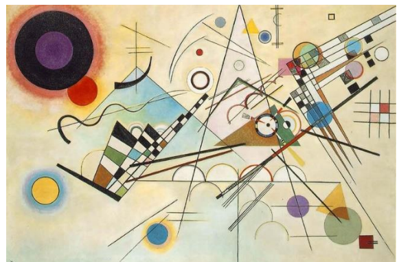
Composición VIII. 1923.