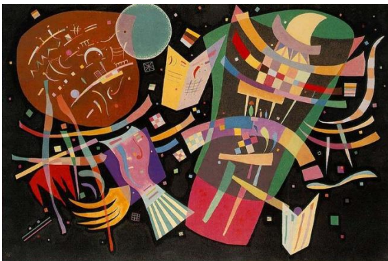
Composición X. 1939

A continuación, cuatro sus mejores obras.