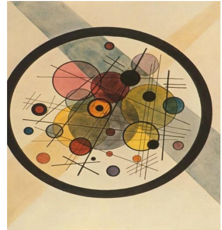
Círculos dentro de círculo. 1911.