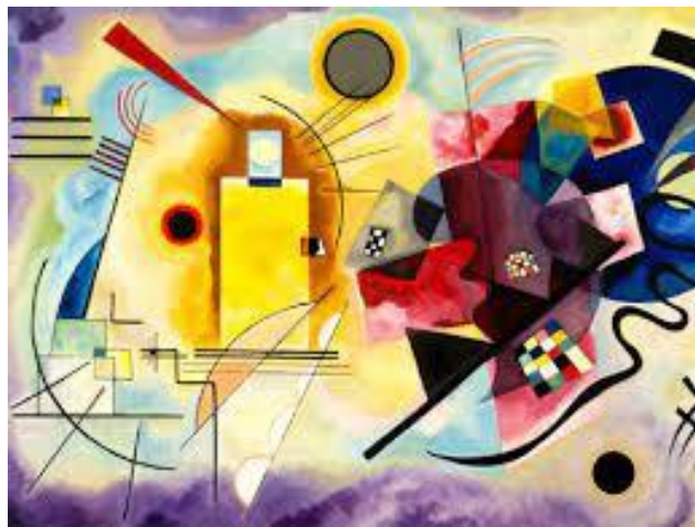
“Amarillo, rojo y azul” Kandinsky, (1925)

Entre 1910 y 1914, Kandinsky pintó numerosas obras que agrupó en tres categorías: las impresiones, inspiradas en la naturaleza; las improvisaciones, expresión de emociones interiores; y las composiciones, que aunaban lo intuitivo con el más exigente rigor compositivo. Estos cuadros se caracterizan por la articulación de gruesas líneas negras con vivos colores; en ellos todavía se percibe un poco la presencia de la realidad.