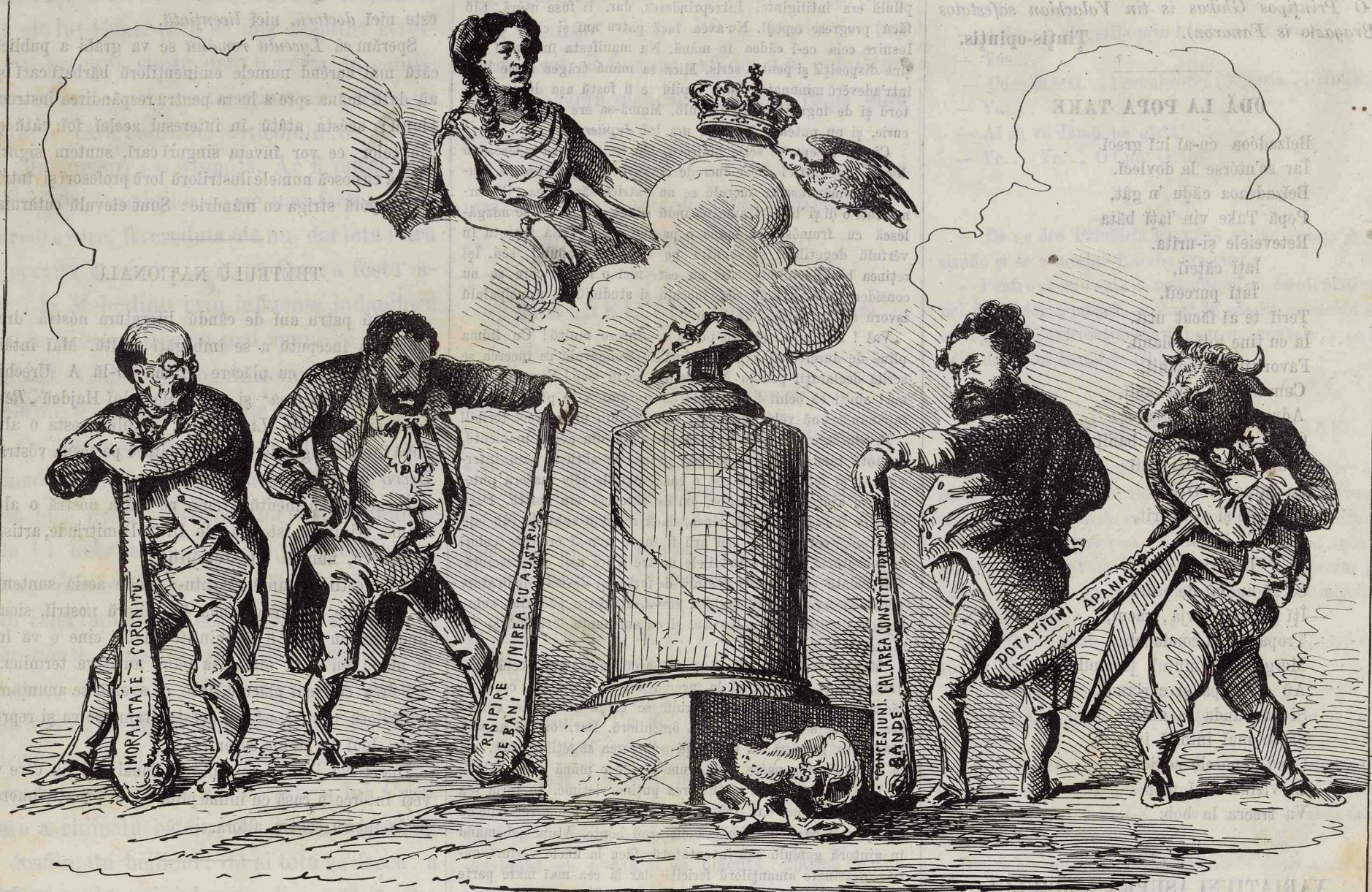
Acum putem să ne repausăm. Idolul poporului de la 1866 este deja sfărâmat!