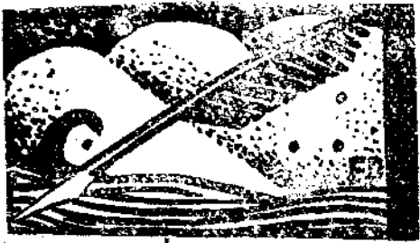
筆 自 丁 伐

據唐山通訊裏說：唐山公安局將聯合日本駐唐憲兵組織什麼軍警聯合督察處。以謀救濟唐山目前日本漢人，朝鮮棒子，和漢奸所造成的恐怖狀態。在當事者自解，也許以為有不得已苦衷；在我們看這不但不能對目前的恐怖狀態有所救濟，反然會益發加甚，因為對「不法之徒」的處治辦法，是一各該管長官帶回一。不懂此也，而且在法律上日本在唐山有了地位。這又該何以自解呢？