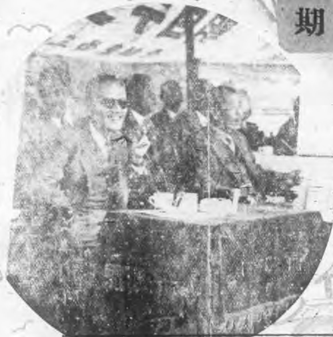
正副院長作壁上觀