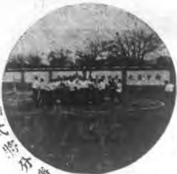
棒倒式將分勝負之