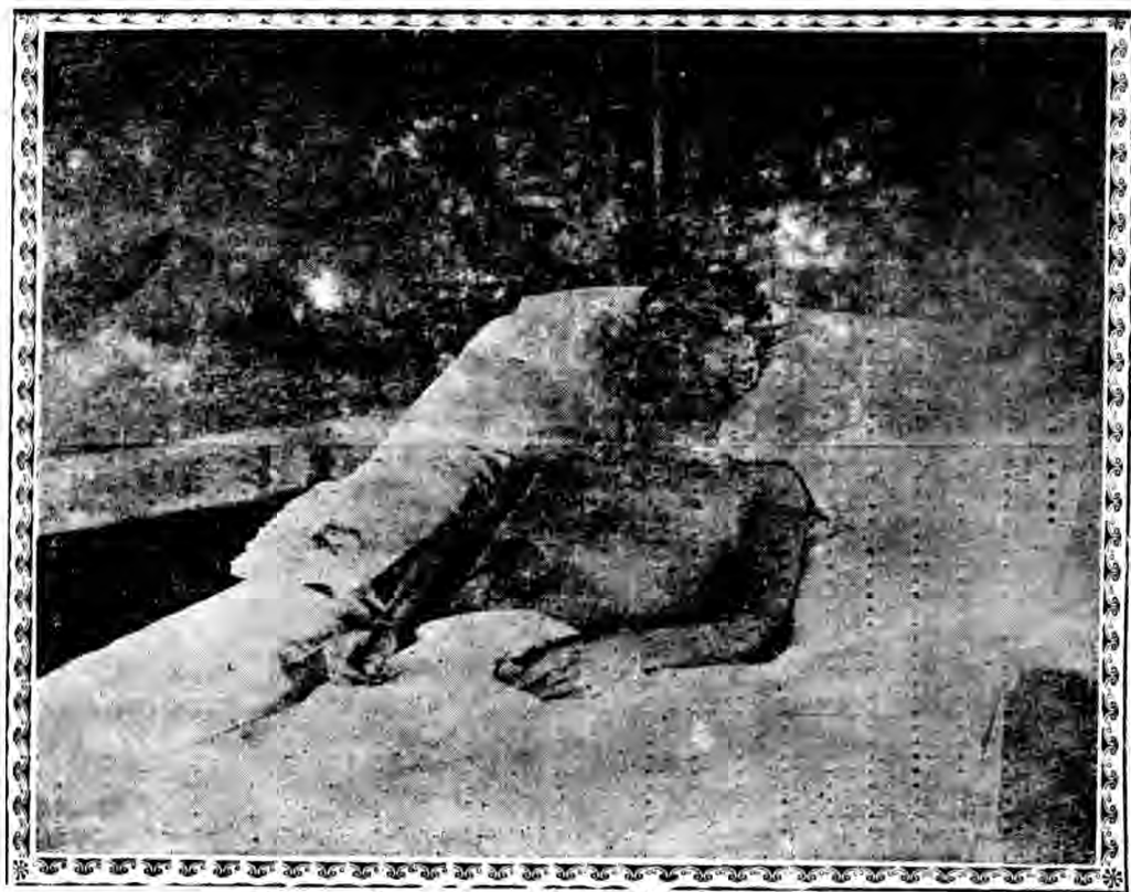
宋 先 生 傷 痕 影