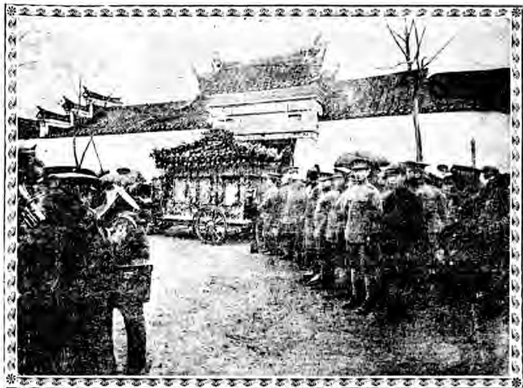
宋先生靈輓抵南湖會館之時攝影