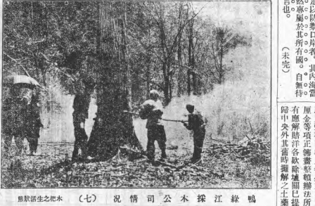
江蘇採探公署司情況 (七) 之木生熟魚

各省財政委員之說帖 財政會議各省代表到鄂，對於湖北財政之現狀，多有評論。委員等認為，湖北財政之困難，在於收入之減少與支出之增加。建議政府應採取措施，以整頓財政，增加收入，減少開支。委員等並建議，應加強稅收管理，嚴厲打擊貪污，以確保財政收入之穩定。此外，亦建議政府應加強與各省之合作，共同解決財政困難。