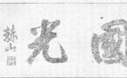
本日本號手勝 (三) 元帥大府山蘇氏