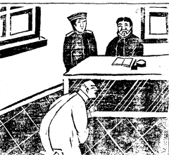
我們主人... 我們主人... 我們主人...