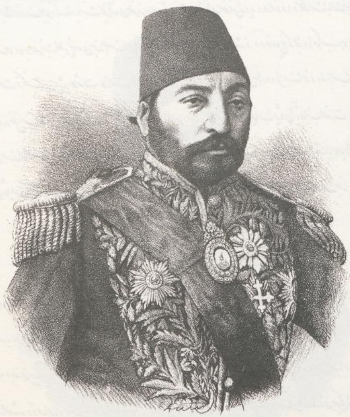
جناب ناصر الملک - وزیر امور د و ن خارج

اتامت در آنجا با ظهور کمال کفایت و کاردانی از جناب ایشان احضار بدر باره ایون شده در سنه ۱۲۷۵ بقلب ناصر الملک و نظام کلیه سوره نظام قزاق رکاب بجناب معزنی اید محال گردید و در هفتاد و شش منصب وزارت تجارت و صنایع دولت علیه منصوب