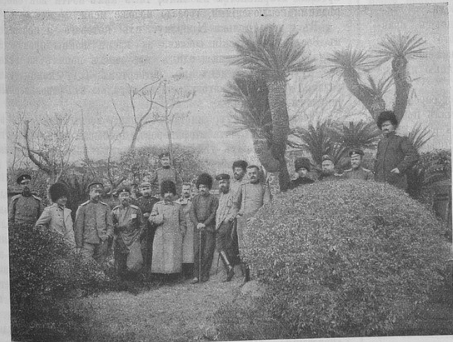
Изъ жизни русскихъ плѣнныхъ въ Японіи. Садъ общежитія «Кванденся», въ г. Мацуямѣ.

А сколько поводовъ къ злоупотребленіямъ было при массовыхъ закупкахъ лошадей, арбъ и другихъ перевозочныхъ средствъ.