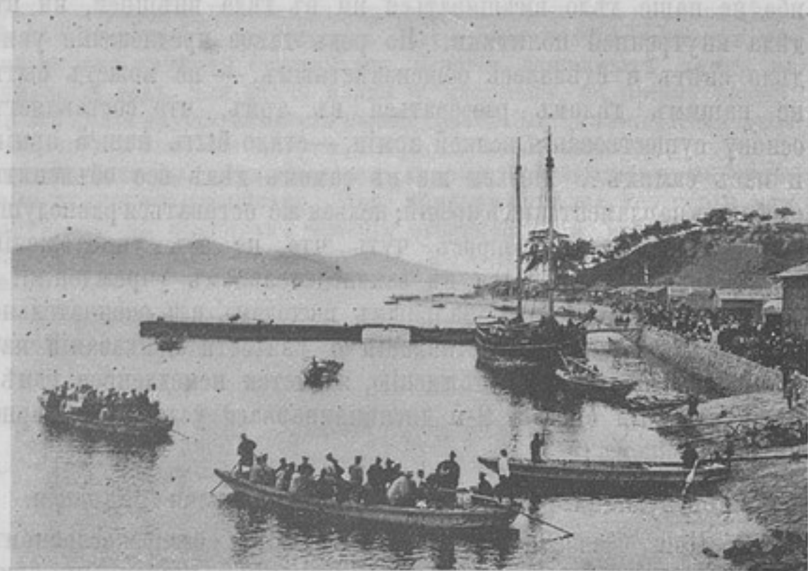
Изъ жизни русскихъ плѣнныхъ въ Японіи. Такахама. Отъѣздъ въ Сидзуока. Кумамото и Фукуока.

онѣ паліативы, не больше. Дѣйствительная же причина доносовъ остается нетронутый, а съ нею неразрывно цвѣтутъ и разрастаются послѣдствія. Даже болѣе, нѣкоторые начальники безмолвно, про себя находятъ доносы полезными, такъ какъ де они открываютъ такіе закоулки въ жизни войскъ и обнаруживаютъ такія стороны, которыя другимъ способомъ никогда бы освѣщены не были.