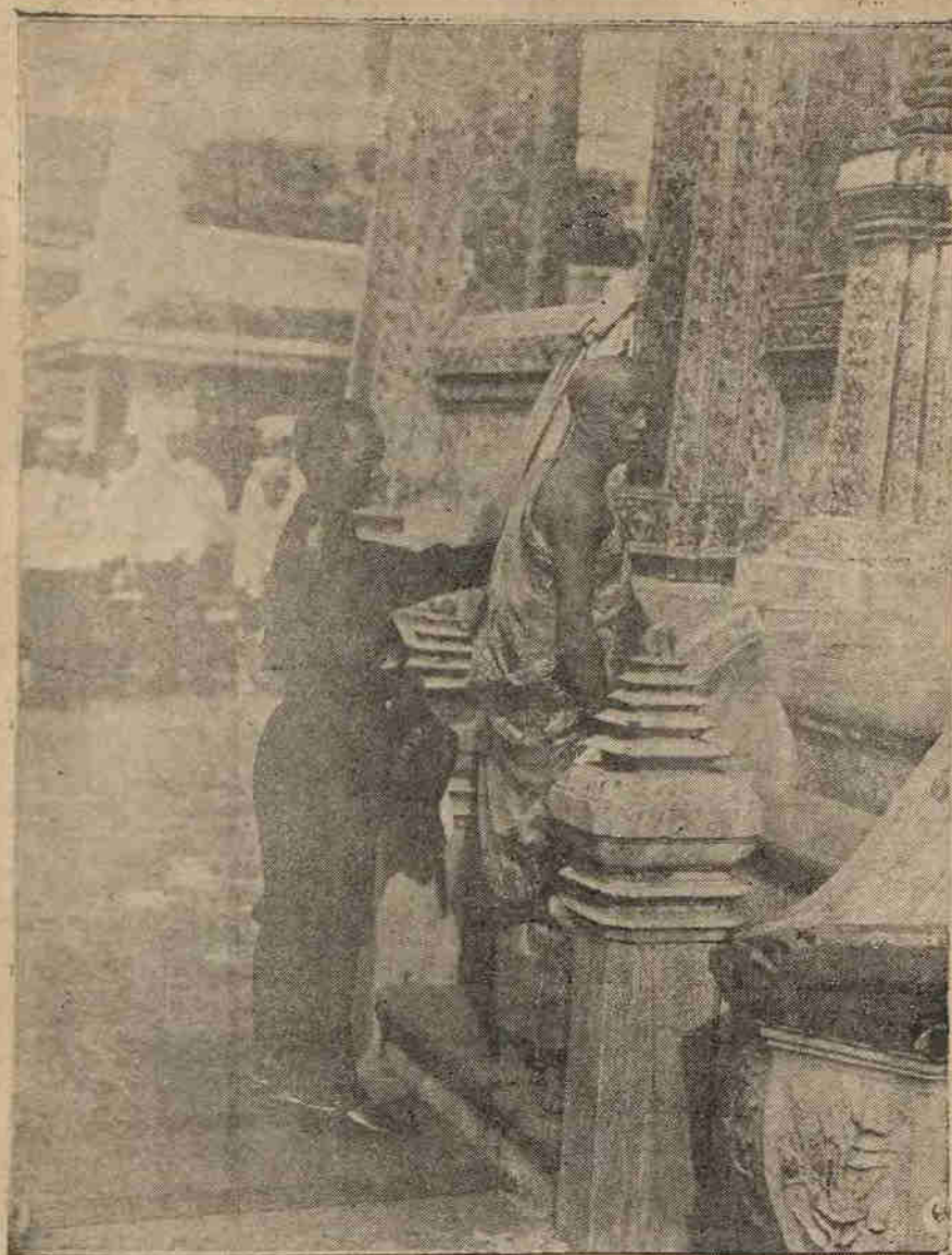
10/03/2565 ทรงผนวชใน พ.ศ. ๒๔๕๕