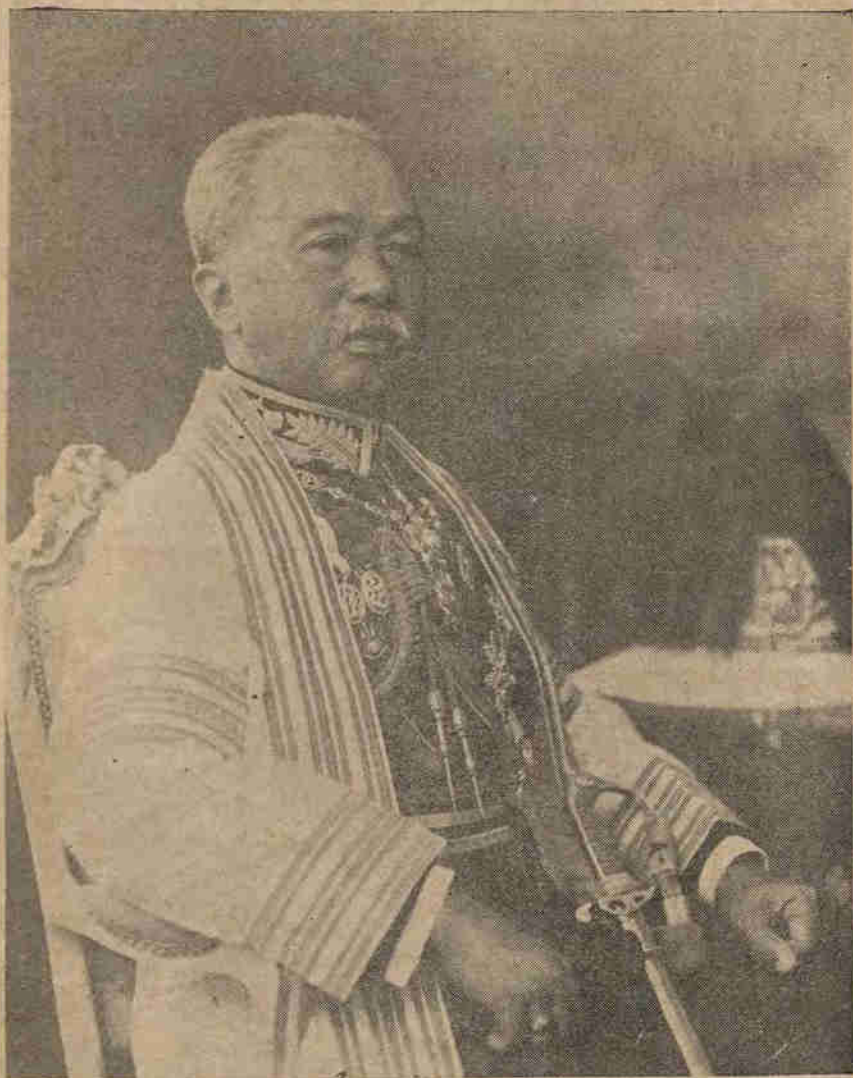
สมเด็จพระเจ้าบรมวงศ์เธอ กรมพระยาดำรงราชานุภาพ พระบิดา ๒๔๐๕-๒๔๘๖