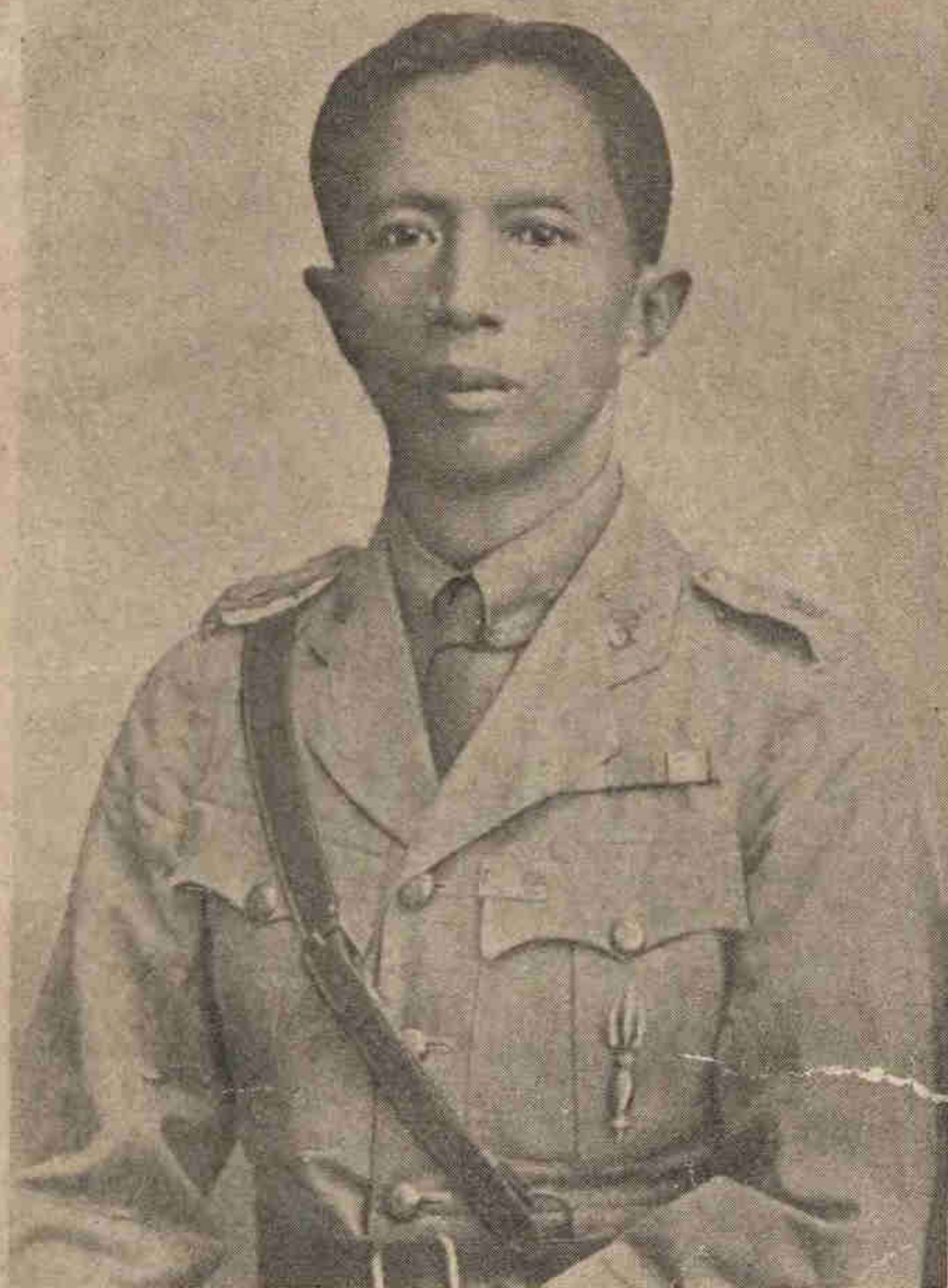
หม่อมเจ้าชุลลทิศ ดิศกุล ท.จ.