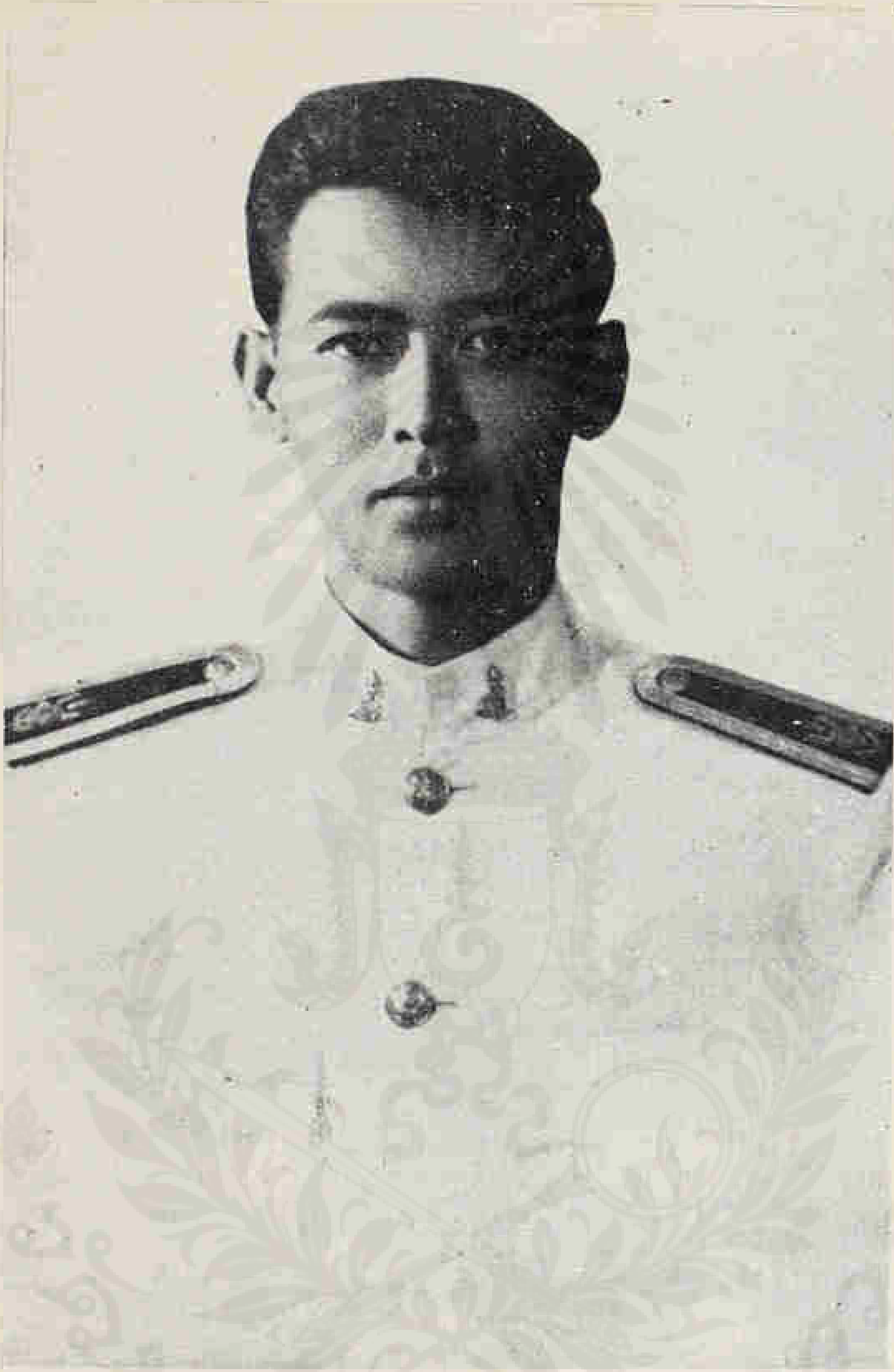
บรรพต เอมส์ฮาท ชาติ ๑๔ กรกฎาคม ๒๔๘๔ มต ๒๑ เมษายน ๒๕๐๕