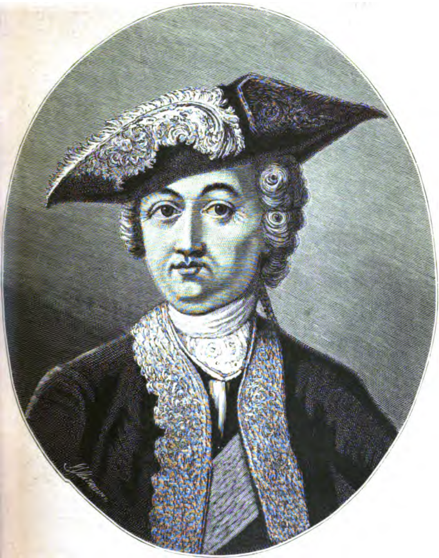
ГРАФЪ ГОТЛОБЪ-КУРТЪ-ГЕНРИХЪ ТОТЛЕБЕНЪ