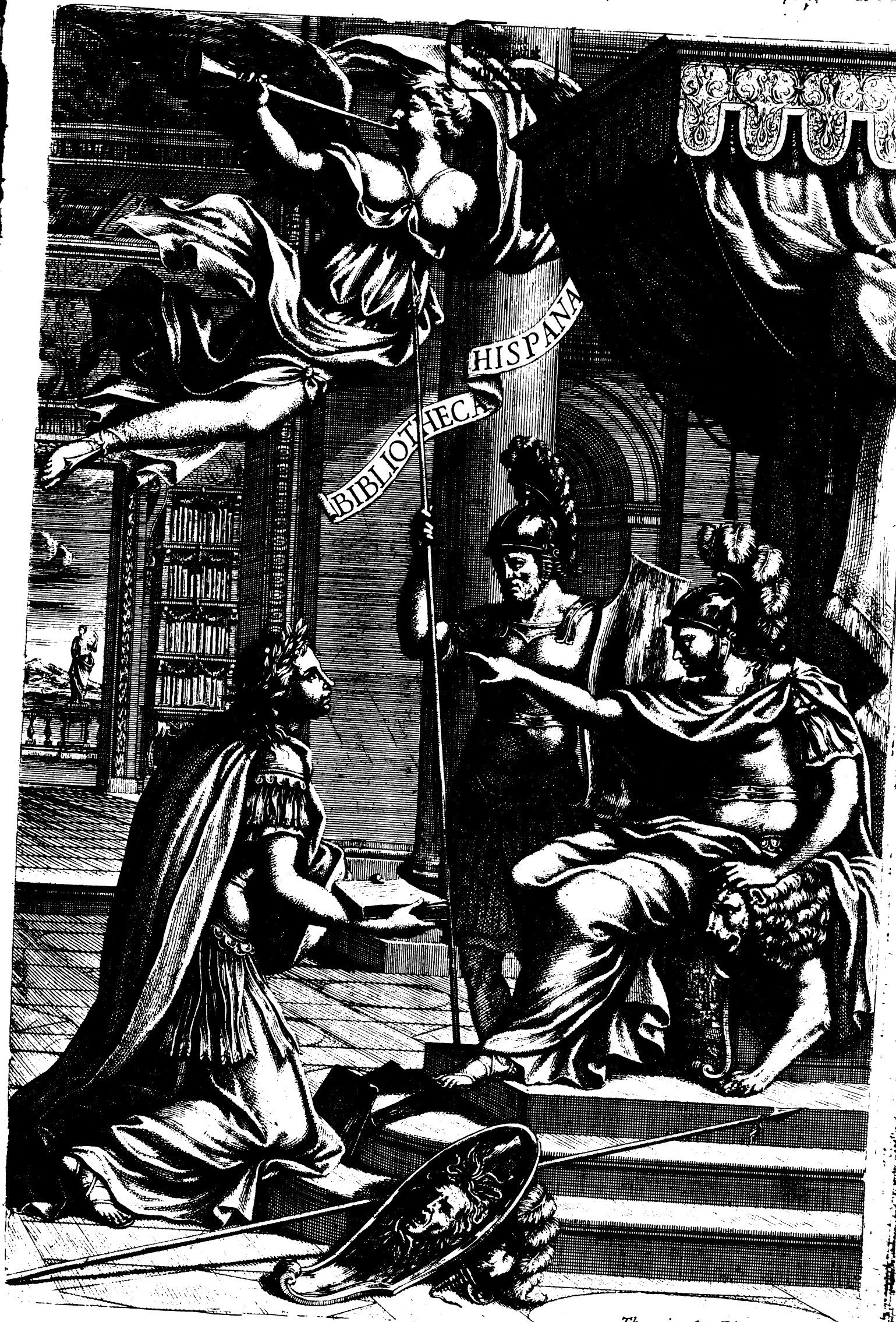
Theresia del Pò Sculp.