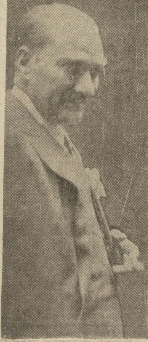
Gazi Hz. nin son seyahat esnasında alınmış resimlerinden biri

Cumhuriyet Halk Fırkası umumî kongresi, intihaptan sonra ve yeni meclisin içtimaaından evvel toplanacaktır. Malûm olduğu üzere yeni mecliste bulunacak meb'uslar Fırka kongresinin tabii azasından maduttur.