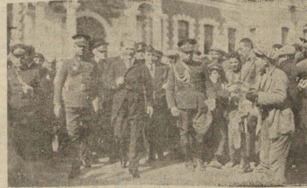
Gazi Hz., Konya'dan hareketlerinden evvel

Büyük taarruz hatıraları Afyonkarahisar 2 (A.A.) — Reisiscumhur Hz. Belediyenin verdiği öğle emeğinde bulunmuşlardır. Saat 15 te alk arasında yürüyerek kolordu ku-