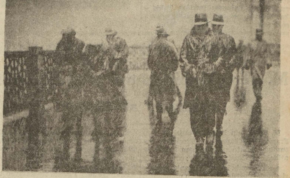
İstanbul'un dünkü karlı manzarasından bir intiba

Fırtına, kar ve soğuk İzmir'de fırtına kasırga halini aldı, her tarafta kar yağıyor