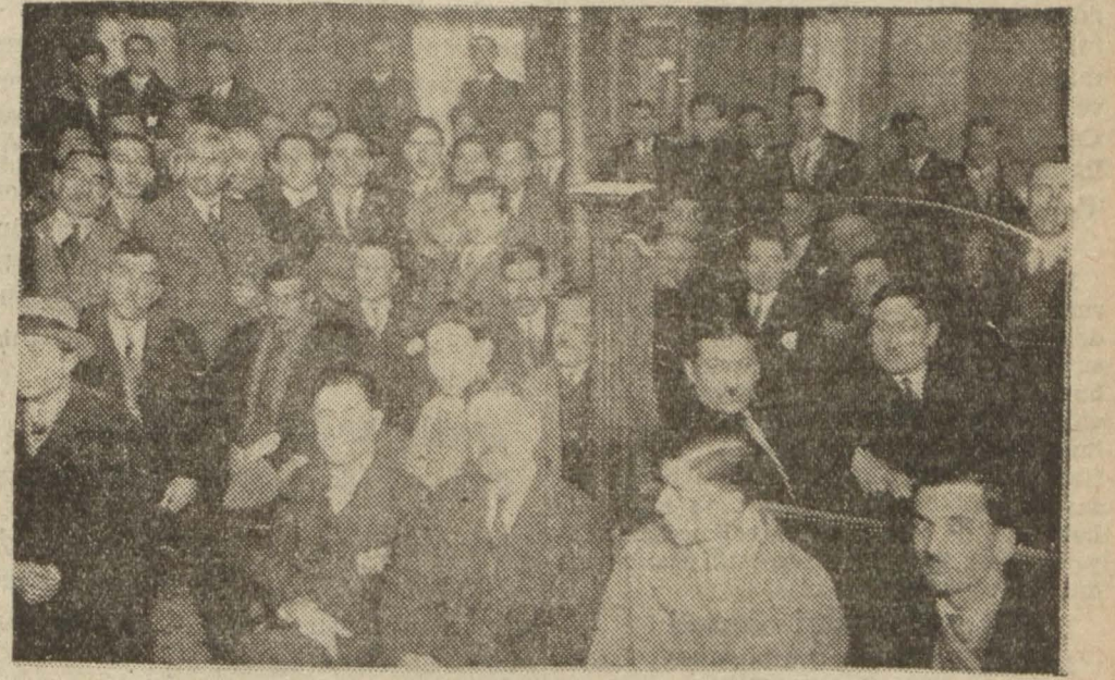
800 berberin hazır bulunarak kararı imzaladığı umumî kongreden bir intiba

Dün toplanan berberler cuma günleri tatil yapmağa karar verdiler