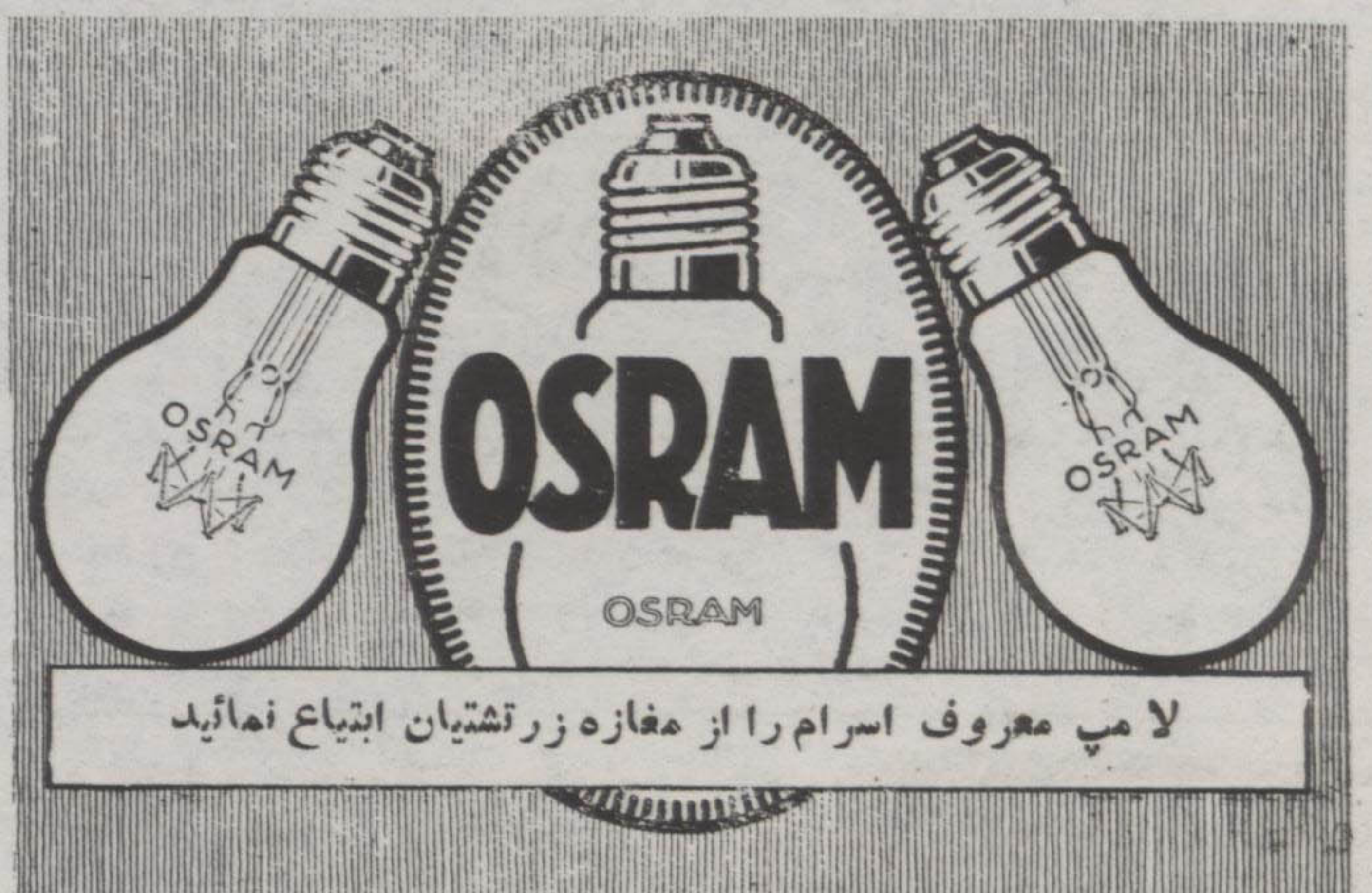
لامپ معروف اسرام را از مغازه زرتشتیان ایتیان نمائید