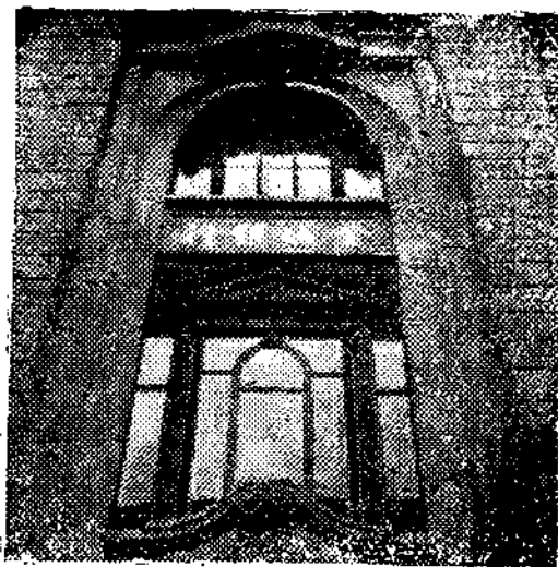
正 面 攝 影