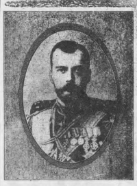
下詔退位之哥尼拉第二