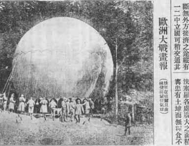
歐洲大戰畫報 (續前頁)