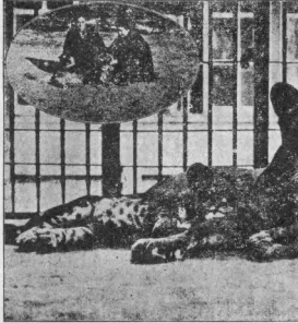
甲之亂事抽象士七十四

甲之亂事抽象士七十四 乙之亂事抽象士七十四 丙之亂事抽象士七十四 丁之亂事抽象士七十四 戊之亂事抽象士七十四 己之亂事抽象士七十四 庚之亂事抽象士七十四 辛之亂事抽象士七十四 壬之亂事抽象士七十四 癸之亂事抽象士七十四