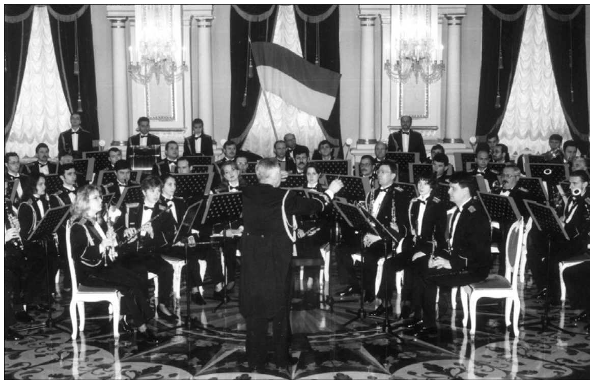
Виступ оркестру в Маріїнському палаці